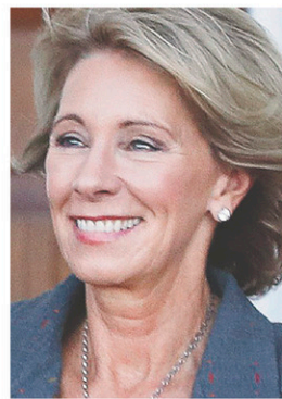
CAROLYN KASTER AP Betsy DeVos

dossiers sur lesquels Donald Trump a affirmé vouloir davantage de coopération avec la Russie.