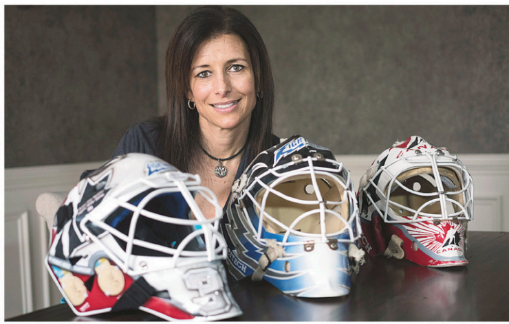
Manon Rhéaume pose avec trois de ses masques dans sa nouvelle résidence d'un chic quartier de Northville, une banlieue de Detroit.

« On m'avait dit non tellement souvent au fil de ma carrière parce que j'étais une fille. Maintenant que quelqu'un me donnait une chance, j'ai dit oui, je la prends. Pour moi, c'était une occasion de vivre