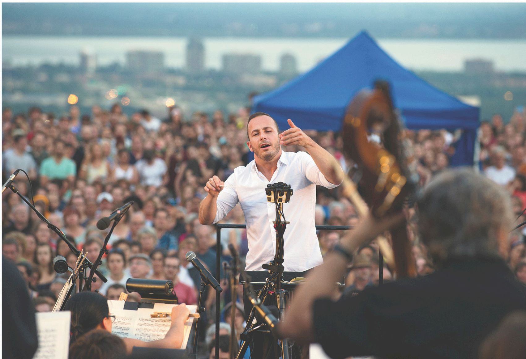
CLÉMENT SABOURIN AGENCE FRANCE-PRESSE

La nuit du Caire l'a avalé, comme d'autres avant et après son passage. « Allah akbar! » chanterait au matin le muezzin du minaret voisin.