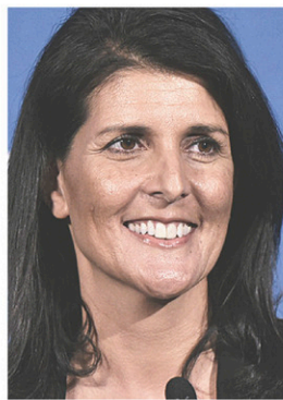
Nikki Haley

À l'ONU, elle devra suivre le développement des crises en Syrie et en Ukraine notamment, des