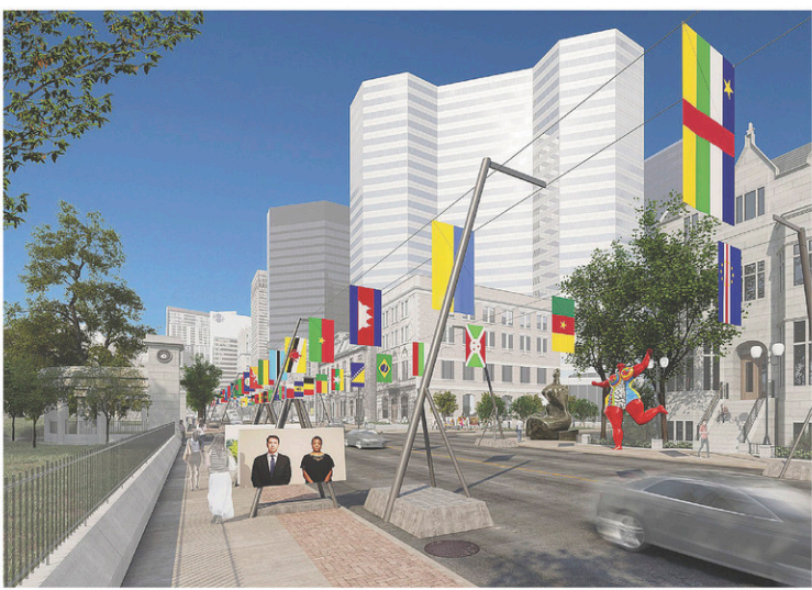
CLAUDE CORMIER ET ASSOCIÉS

La balade pour la paix. Un musée à ciel ouvert trace un itinéraire entre le Musée McCord, et le nouveau Pavillon pour la paix Michal et Renata Hornstein du MBAM.