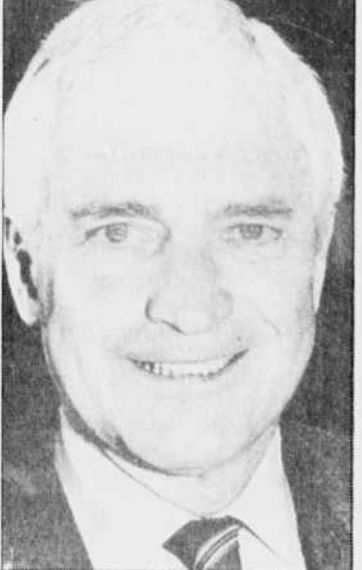
John Turner: les organisateurs voulaient le cacher...