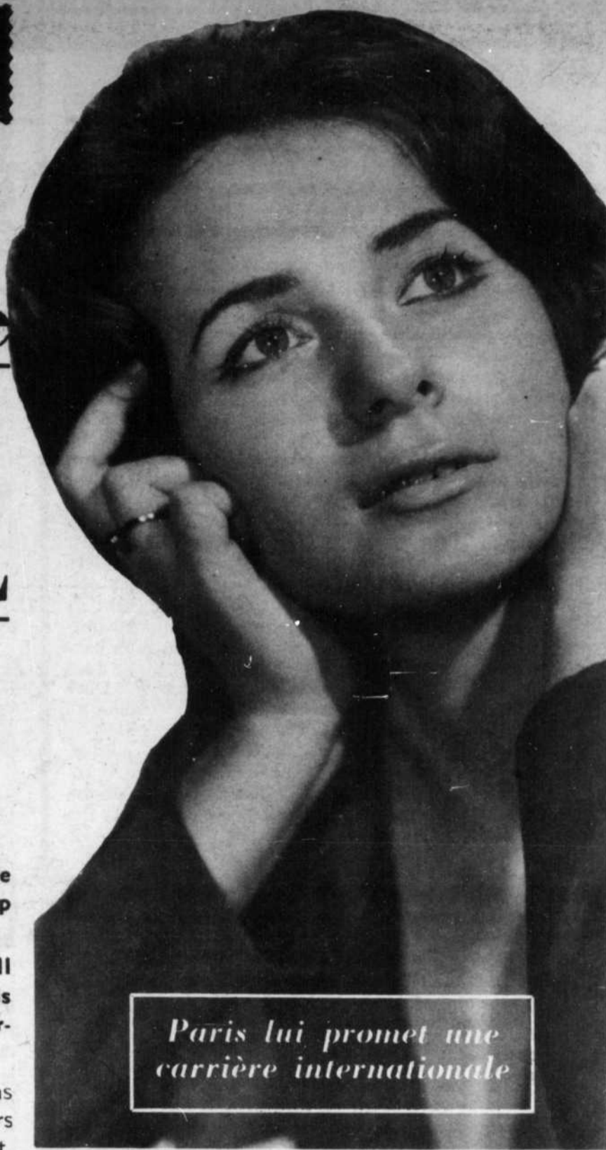
Paris lui promet une carrière internationale

En grande vedette au "Baron" du 30 décembre au 5 janvier