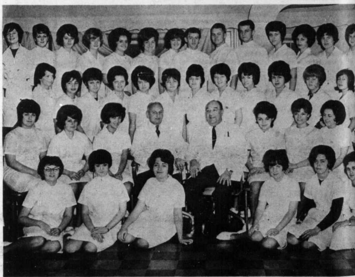
PHOTO DES ELEVES DU COURS 1963-64

Voulez-vous devenir coiffeur ou coiffeuse ?