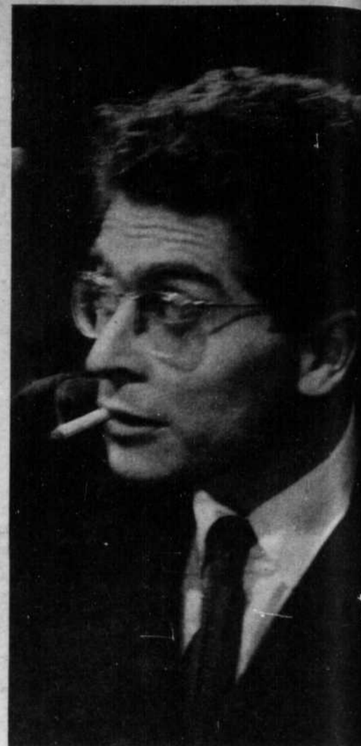
DARRY COWL : comique du cinéma français, que nous reverrons le 7 janvier à CFTM, à 11.15 p.m., dans le film "Jamaïque".