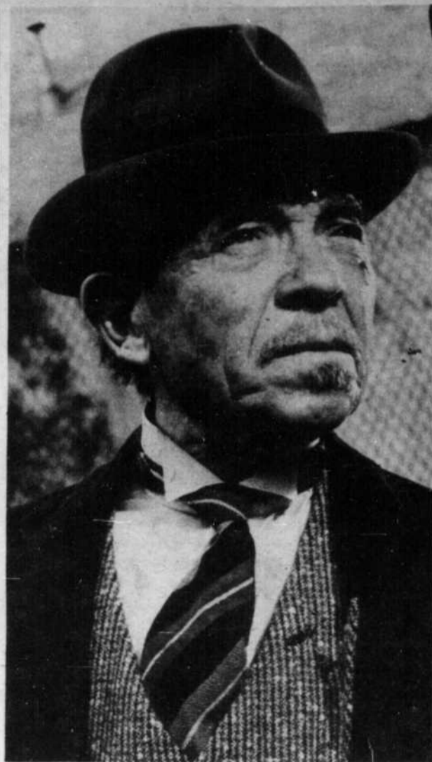
PIERRE LARQUEY : sympathique figure de l'écran français que nous reverrons le 2 janvier, à CFTM, à 1 h. 15 p.m., dans le film "La peau d'un homme".