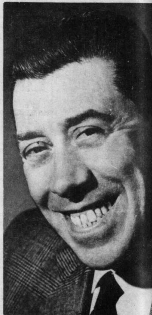
FERNANDEL : le géant de l'écran, que nous reverrons le 8 janvier, à CBFT, à 11.00 p.m., dans l'un de ses meilleurs films, "Crésus".