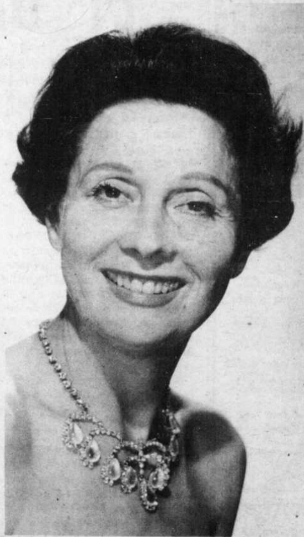
ARLETTY : le titi du cinéma français, que nous reverrons le 3 janvier, à CBFT, à 8.30 p.m., dans le film "La loi des hommes".