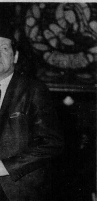
nts déshérités étaient Jean apporté leur entrain, leur aux enfants.