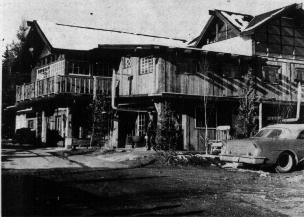
La "Butte à Mathieu" de Val David, petit royaume de la chanson au coeur des Laurentides, où les chansonniers sont des rois adulés.