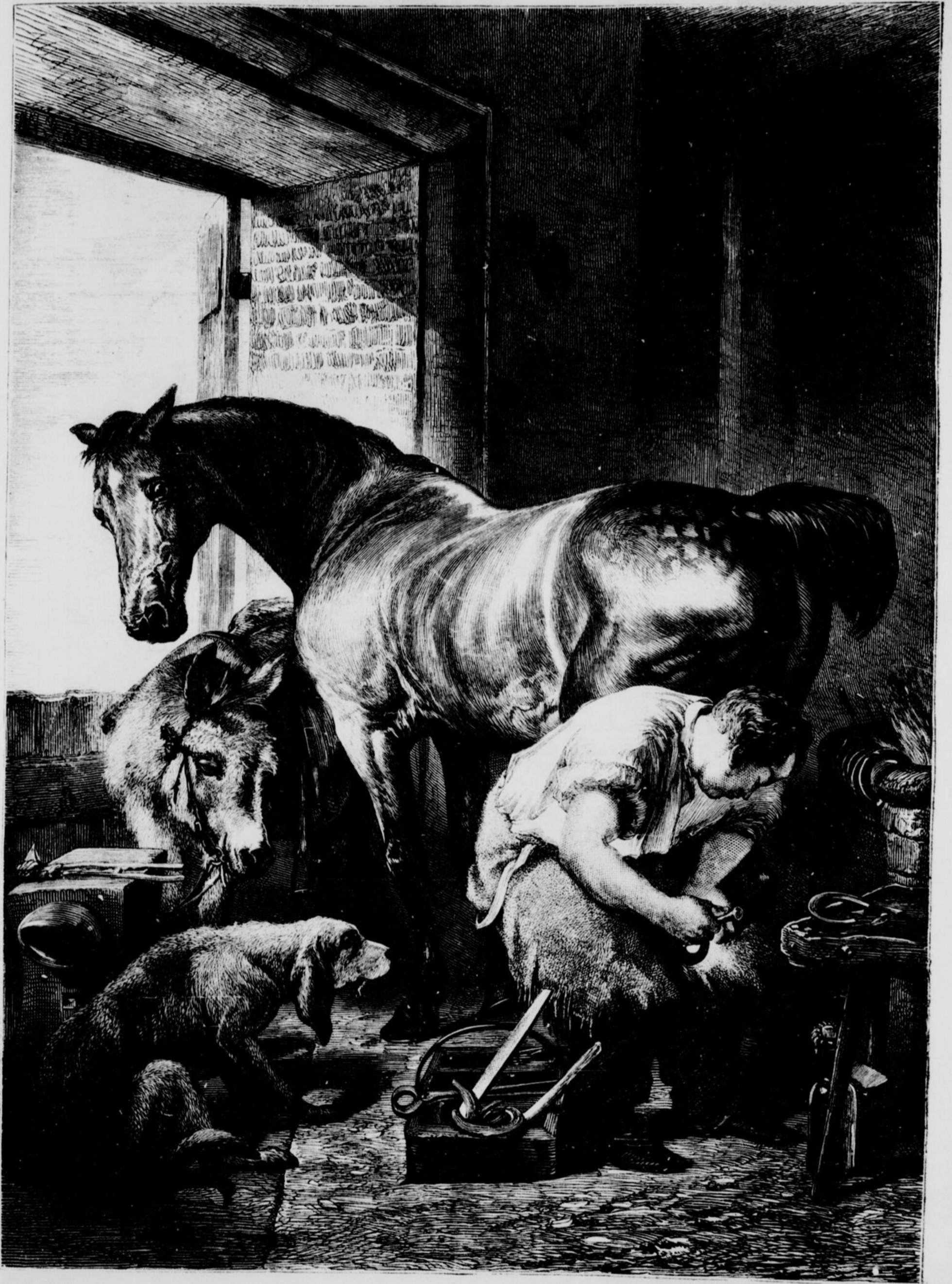
LE MARÉCHAL FERRANT