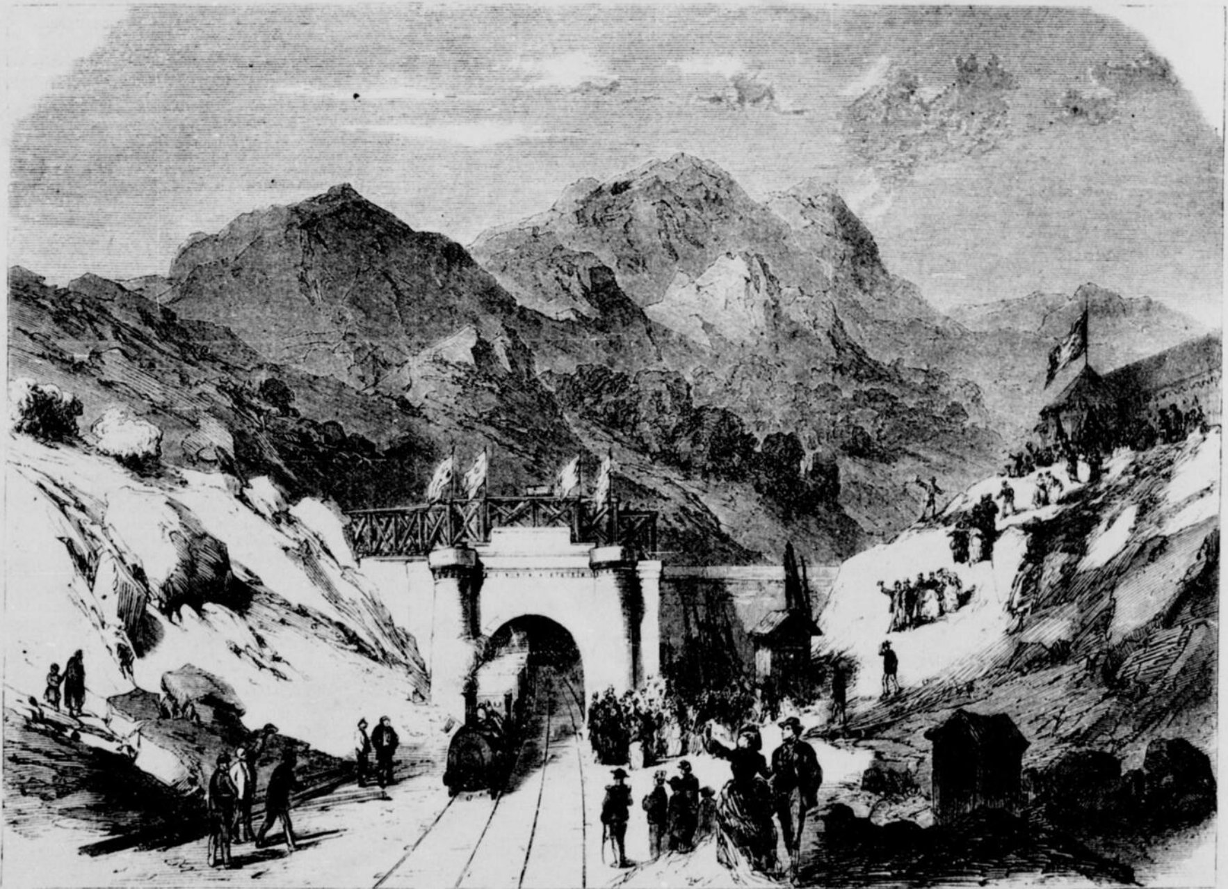
LA PERCÉE DES ALPES.—ARRIVÉE DU PREMIER CONVOI DU CÔTÉ ITALIEN

"Tu te plains, mon pauvre mari, de tes dix heures d'ouvrage ; voici quatorze heures que je travaille, moi, et je n'ai pas encore fini ma journée."