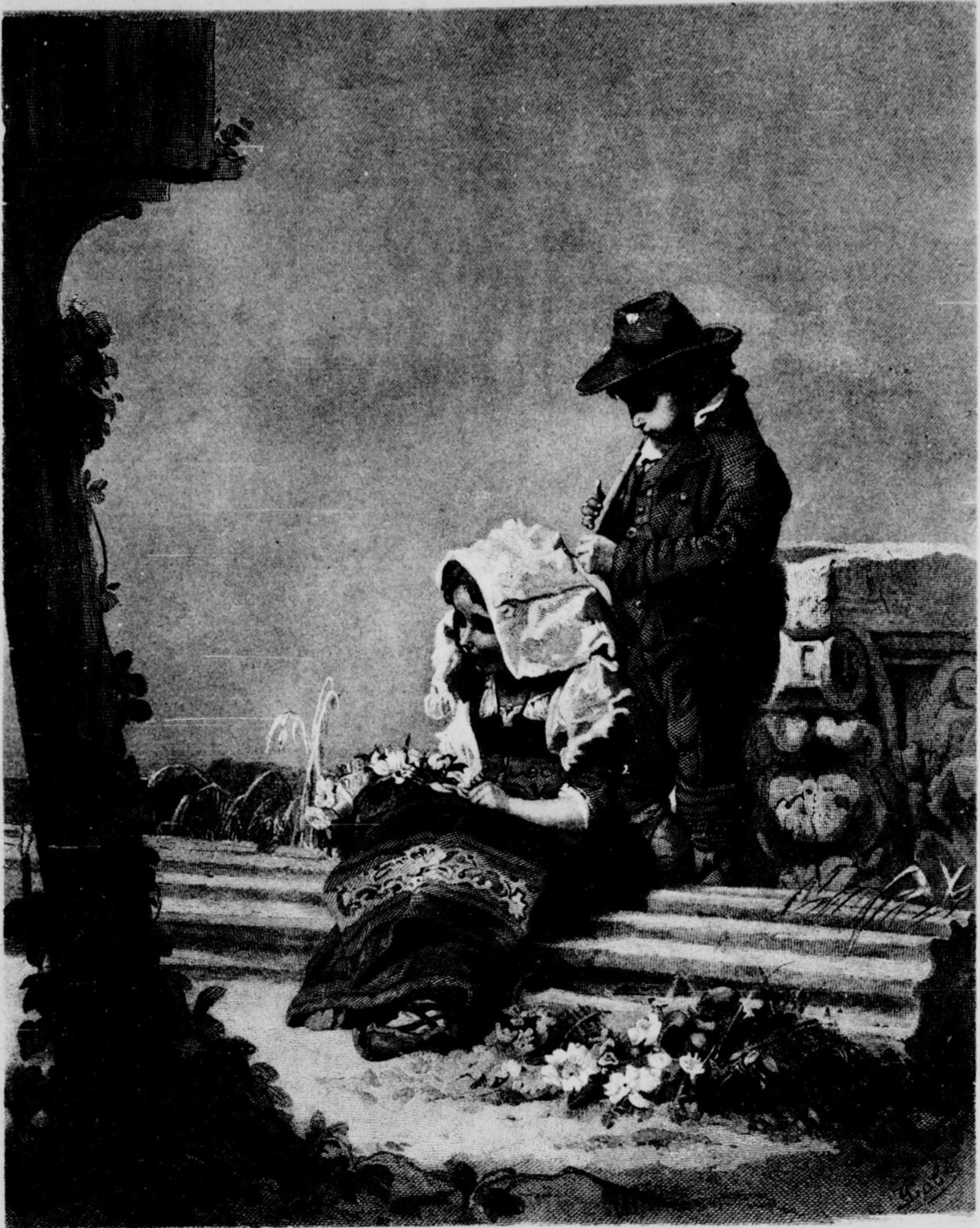
LES PETITS PELERINS.