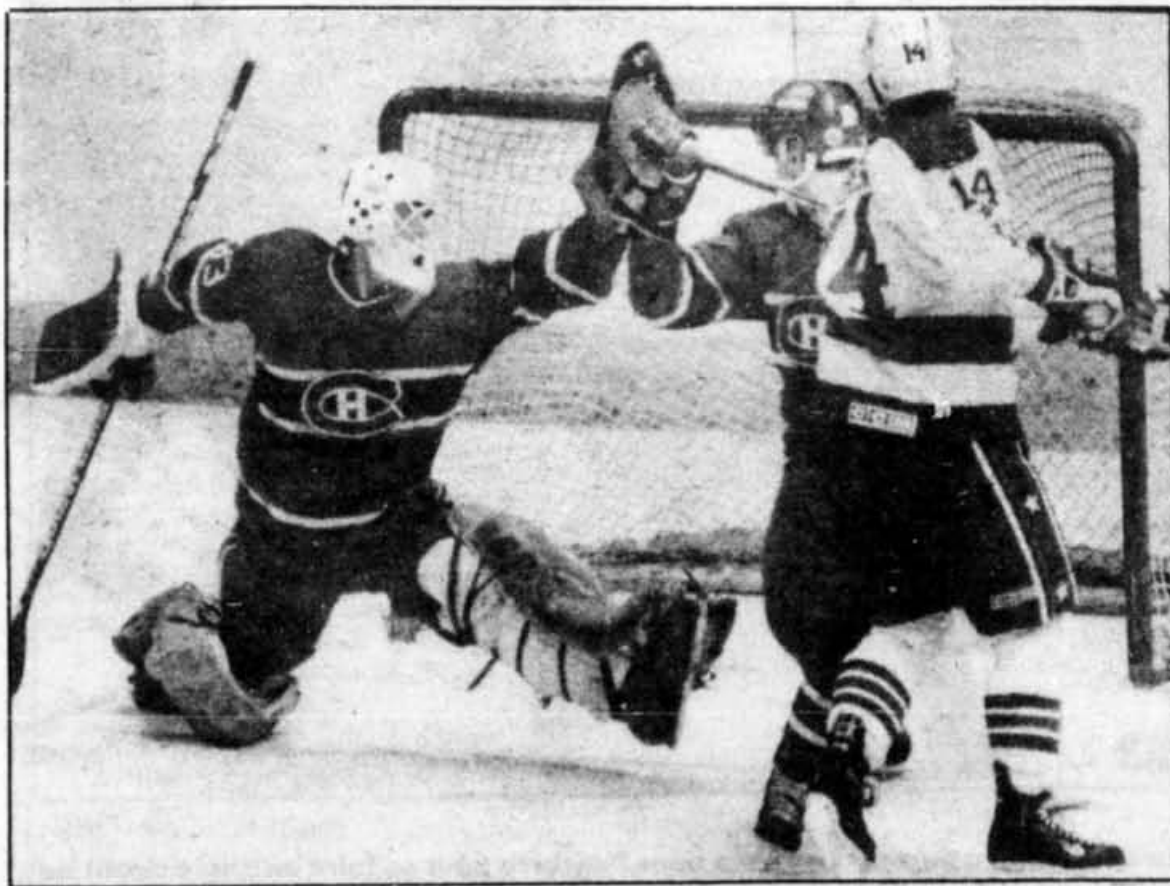
Quelques fois brillant, quelques fois béni des dieux, Patrick Roy a connu un bon contre les Capitals. Voilà de bonnes nouvelles après les contre-temps des derniers jours.