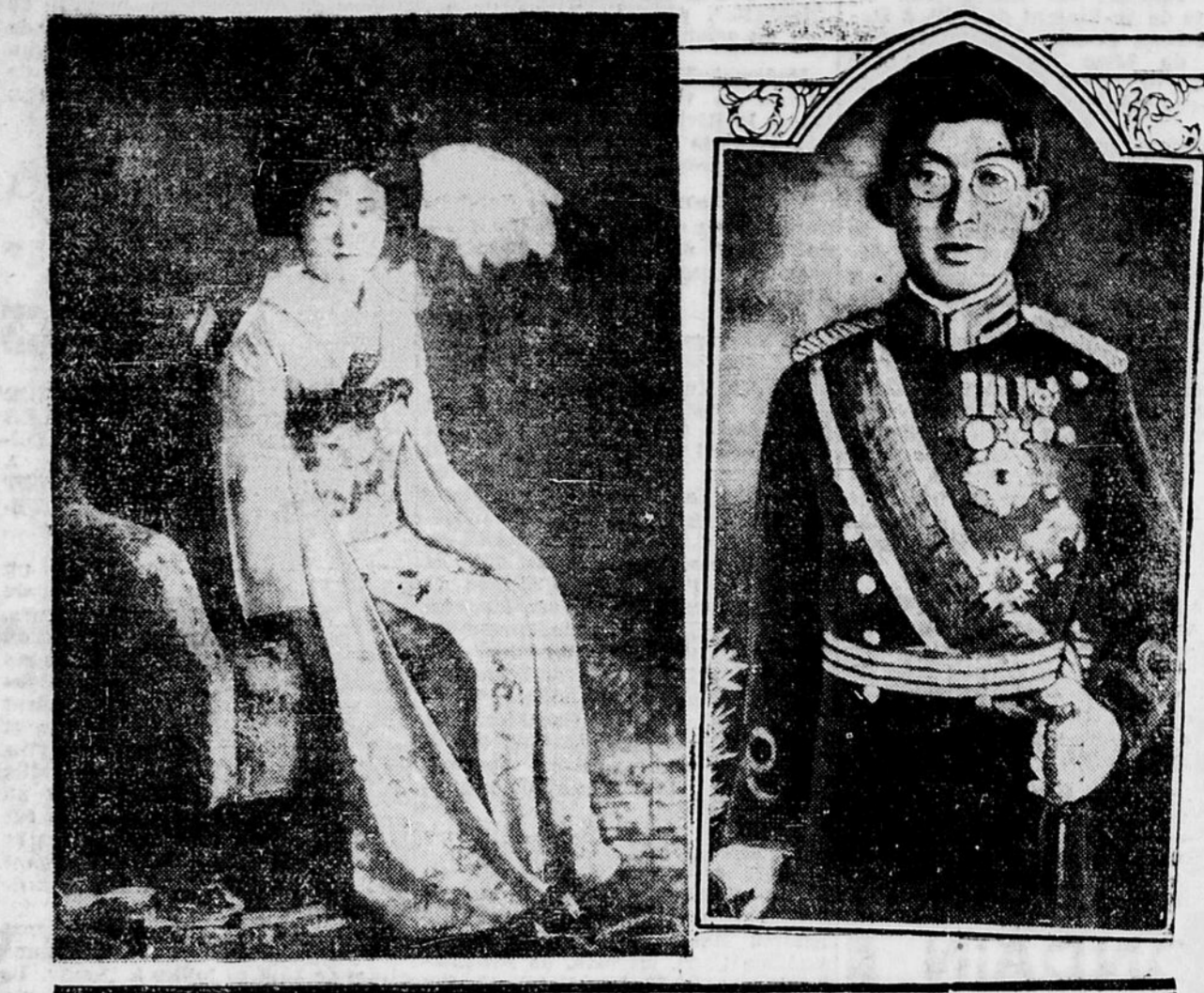
Le prince Chichibu, héritier du trône japonais, épousera le 28 septembre, Setsuko Matsudaira, fille de l'ancien ambassadeur japonais aux Etats-Unis. On voit ici le prince, dans son uniforme de lieutenant, et à gauche la future princesse.