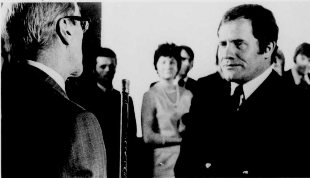
La Canne à pommeau d'or