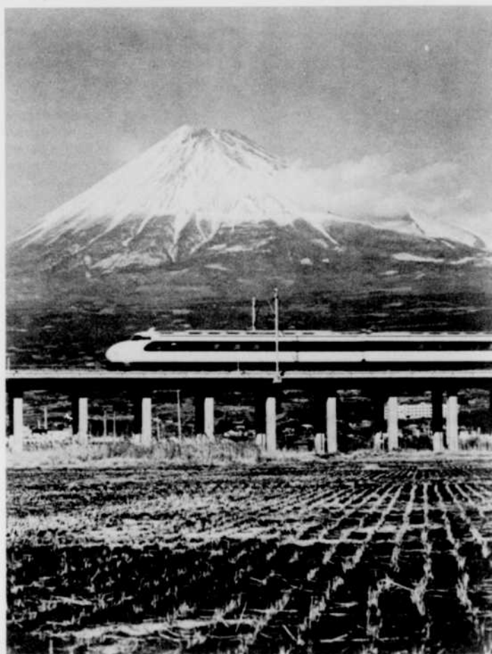
Le super express «Hikari»; à l'arrière-plan: le Fuji-Yama