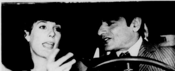
Une belle fille comme moi