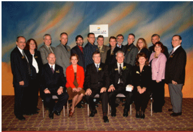
En image, la fête des retraités et des 25 ans de service du personnel.