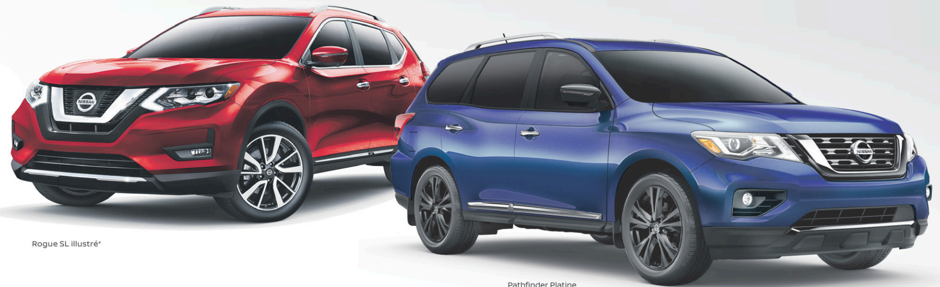
Rogue SL illustré*