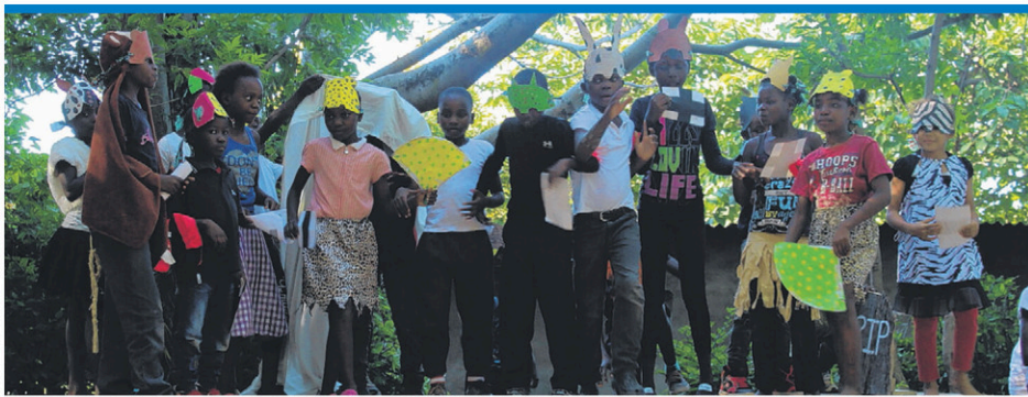
Une des représentations de la pièce de théâtre montée par Francis Roy et les jeunes de Nkhata Bay.