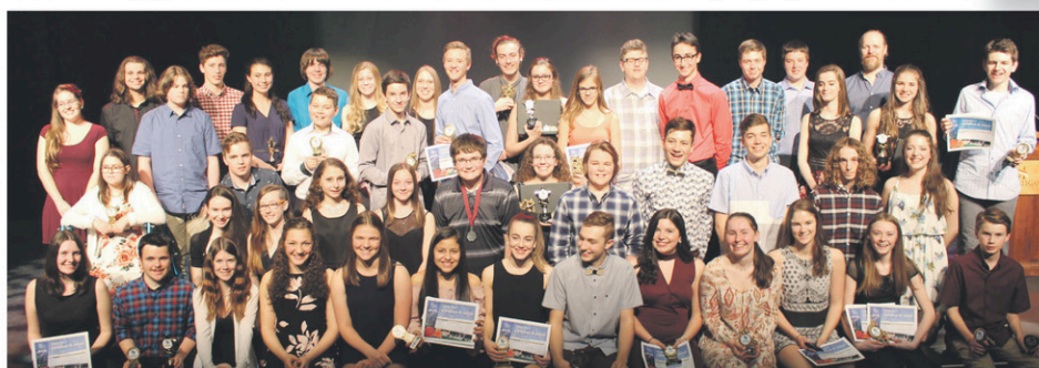
Tous les lauréats du Gala Méritas 2017.