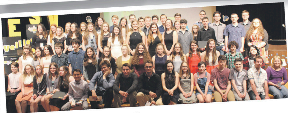
Les élèves méritants de l'ESV pour 2016-2017.