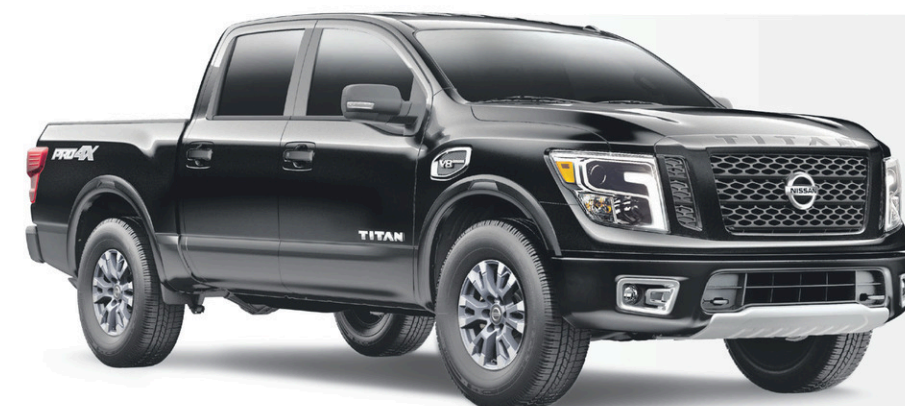
Titan Pro-4X illustré*