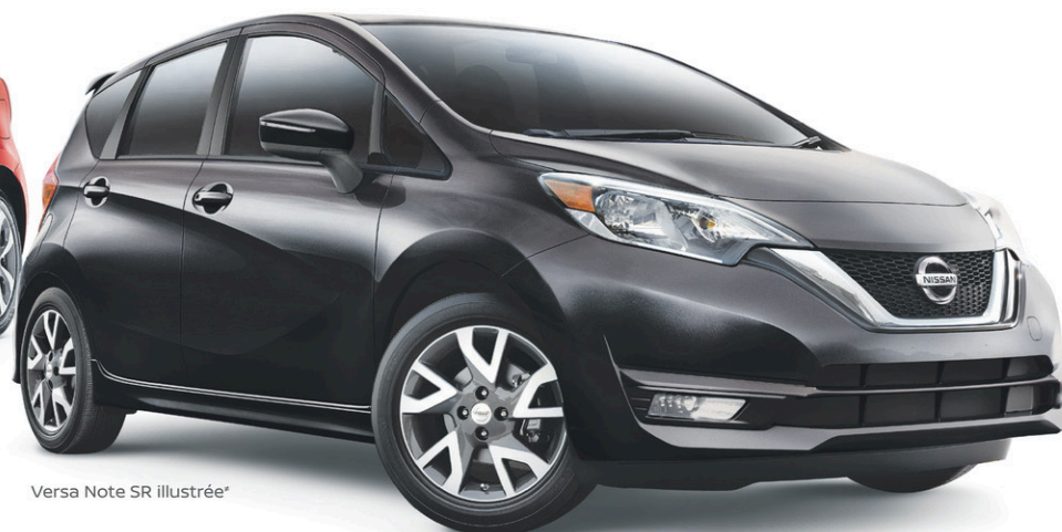
Versa Note SR illustrée*