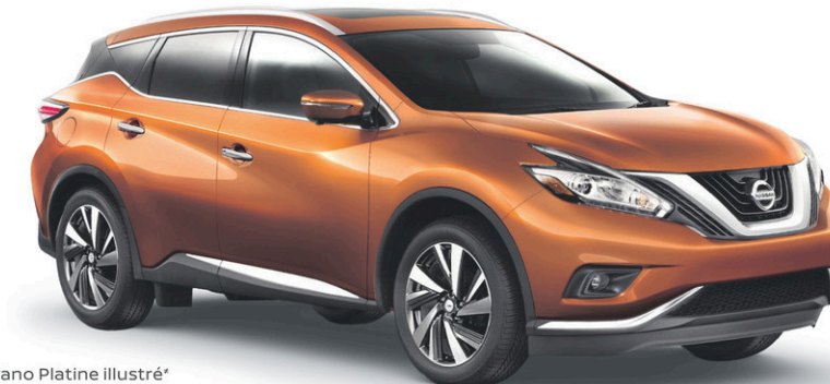
Murano Platine illustré*

C'EST COMME PAYER 47$ /SEMAINE PENDANT 39 MOIS