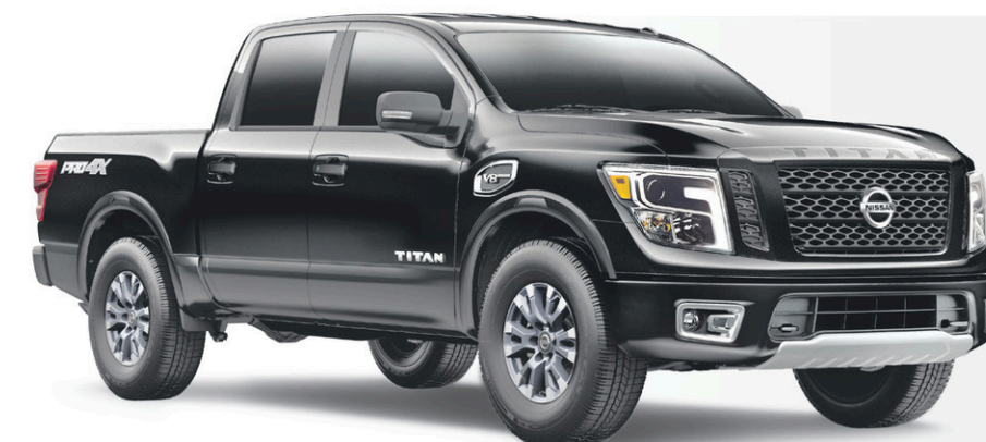
Titan Pro-4X illustré*