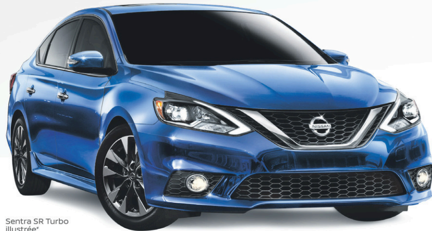
Sentra SR Turbo illustrée*