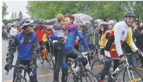
Un moment rempli d'émotions pour les participants accueillis par les élèves et des proches.

L'activité faisant la promotion des saines habitudes de vie, permettra de verser plus de 155 000 $ à 37 des 39 écoles primaires de la Commission scolaire Beauce-Etchemins (CSBE) s'étant qualifié au défi Cubes énergie du Grand défi Pierre Lavoie (GDPL). Celui-ci a été remporté par l'école le Plateau de Saint-Prospère-Saint-Benjamin, suivi de l'école des Deux-Rives et l'école Louis-Albert-Vachon de Saint-Frédéric.