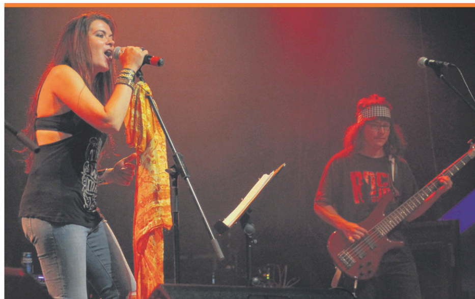
L'une des prestations présentées au Rock Jam l'été dernier.