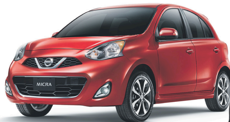
Micra SR illustrée*

3 e BANQUETTE POUR ACCUEILLIR 7 PASSAGERS