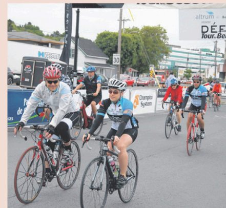
Le Défi Tour de Beauce souhaite avoir l'appui d'une centaine de cyclistes.

Les deux groupes seront réunis de 14h 15