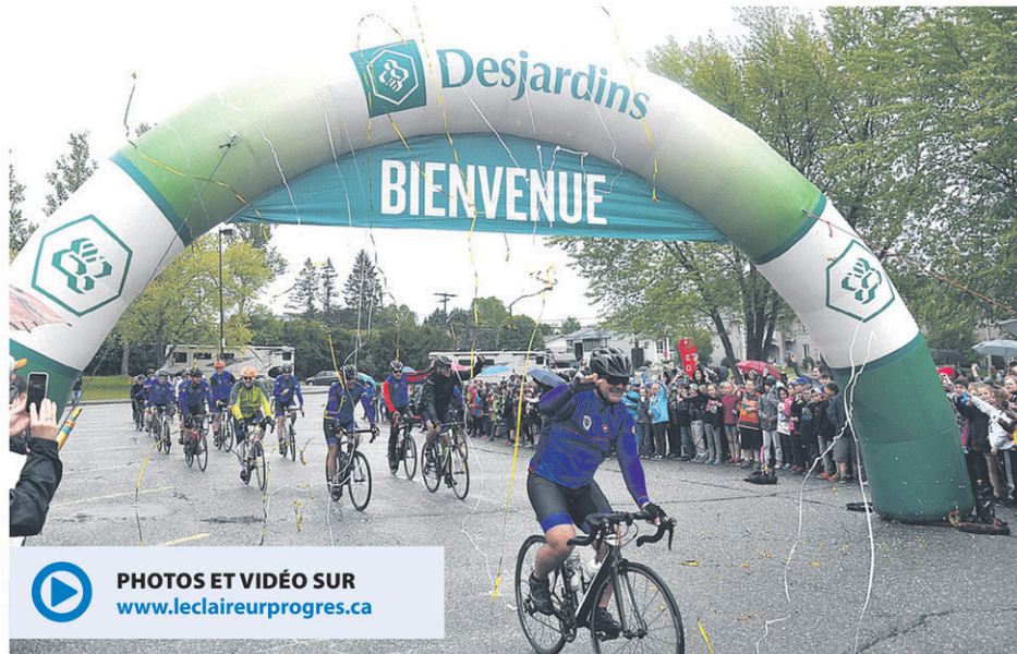
C'est avec grand soulagement que les cyclistes ont franchi la ligne d'arrivée.