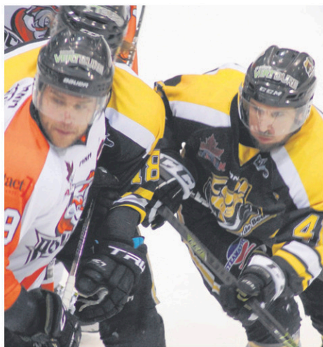
Y aura-t-il du hockey de la LNAH la saison prochaine ?

Le président de l'organisation beauceronne ajoute même avoir mis en contact