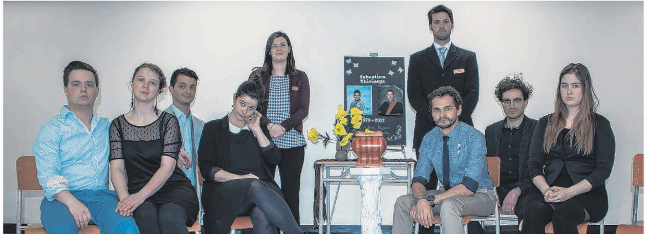
La troupe de théâtre La Meute sera à Grenoble pour représenter le Canada lors des rencontres du jeune théâtre européen avec la pièce Mes sympathies .

La pièce sera aussi présentée le 17 juin au Centre Lucien-Borne à Québec ainsi que le 20 janvier 2018 à Sainte-Marie. Les billets pour la représentation en Beauce seront en vente au coût de 32 $ dès le 10 juin prochain sur ovascene.com .