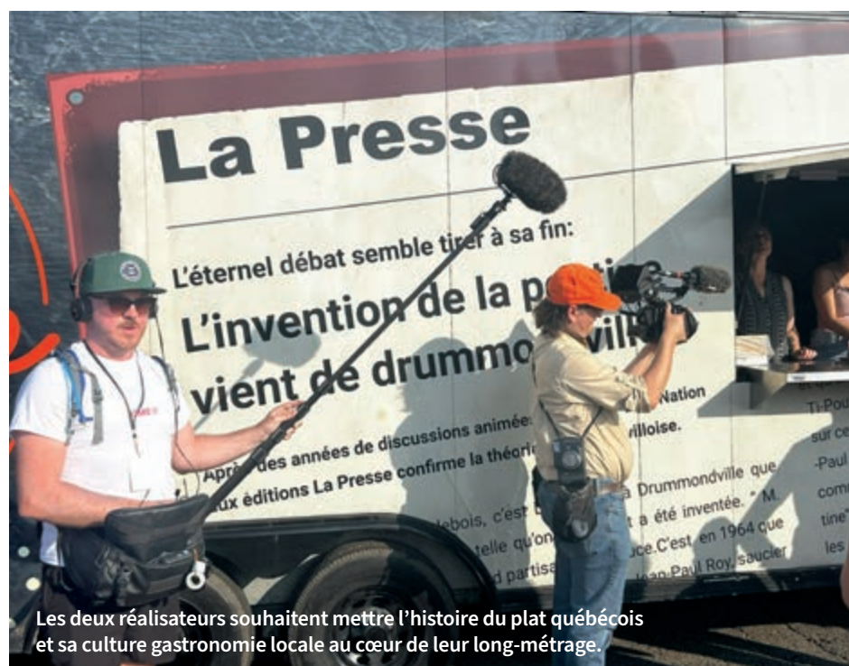
Les deux réalisateurs souhaitent mettre l'histoire du plat québécois et sa culture gastronomique locale au cœur de leur long-métrage.