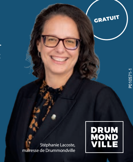
Stéphanie Lacoste, mairesse de Drummondville