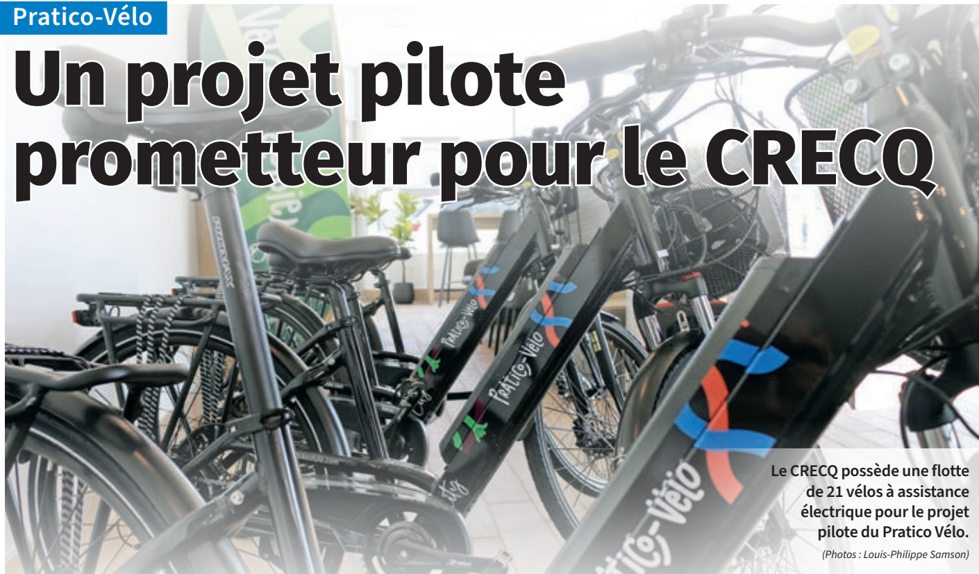
Le CRECQ possède une flotte de 21 vélos à assistance électrique pour le projet pilote du Pratico Vélo.