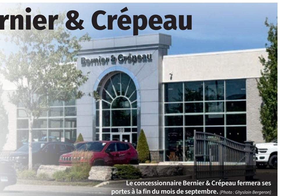
Le concessionnaire Bernier & Crépeau fermera ses portes à la fin du mois de septembre.

Selon les dires du directeur général, Chrysler voudrait conserver une concession à Drummondville. «Nous étions à vendre. On n'a juste pas trouvé preneur. On peut com-