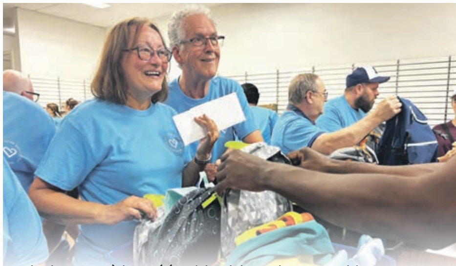
Plus de 1100 sacs à dos ont été remis lors de la Grande procure scolaire.