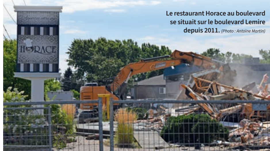
Le restaurant Horace au boulevard se situait sur le boulevard Lemire depuis 2011.

À la suite d'un incendie de l'ancienne succursale à l'automne 2010, le restaurant