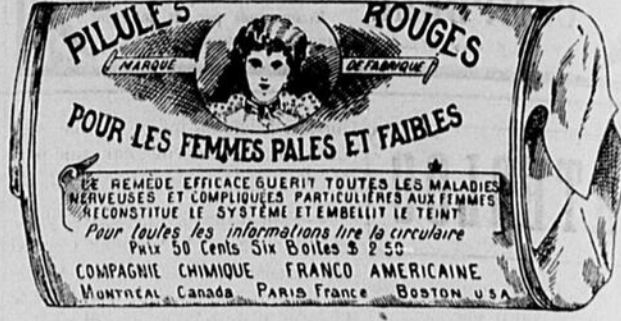
Fac-similé exact d'une boîte de Pilules Rouges.

Nos Pilules Rouges sont une spécialité pour les maladies des femmes seulement; c'est ce qui fait leur force et leur popularité. Il est impossible à un remède de guérir tous les maux. Jamais, dans l'histoire de la médecine, un remède n'a obtenu autant de guérisons que nos Pilules Rouges. Nous demandons à nos nombreuses clientes de ne pas comparer nos Pilules Rouges aux autres remèdes guérissant tous les maux, entre autres, aux remèdes liquides qui ne doivent leur effet stimulant qu'à l'alcool qu'ils renferment.