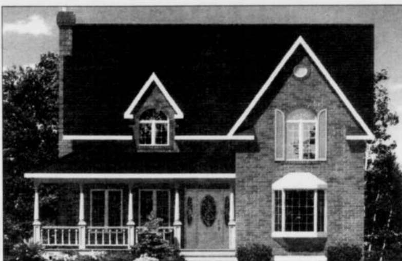
MAISON - Les maisons R-2000 ont un effet positif sur le plan de l'environnement.

Une maison certifiée R-2000 coûte entre 5 000 et 8 000 $ de plus à construire qu'une maison