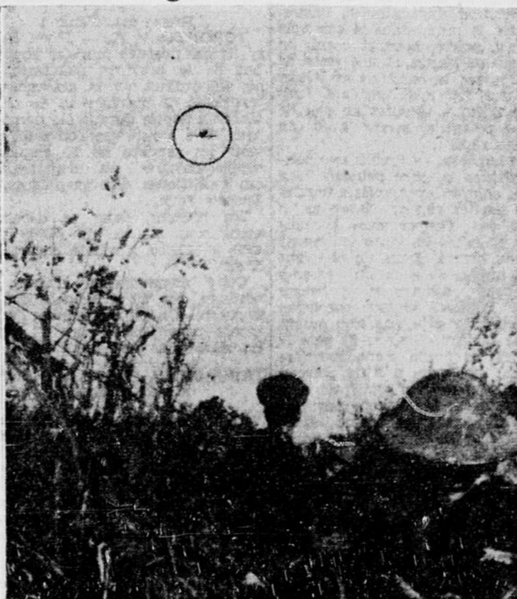
Ces soldats de l'arrière-garde de la deuxième force expéditionnaire britannique en France, saluent d'un dernier coup de fusil un avion ennemi dans les airs (dans le cercle). Ceci se passait au cours de la retraite de France.