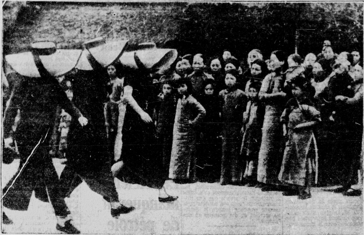
La petite Chinoise, à droite, qui a les mains posées sur son tablier, se demande sans doute quel costume apparaîtront encore les grandes dames. De gauche à droite, sous ces chapeaux d'un genre particulier, se trouvent Mme H.-H. Kung, épouse du ministre des Finances; Mme Chiang Kai-Shek, et Mme Sun Yat-Sen, épouse du fondateur de la république de Chine.