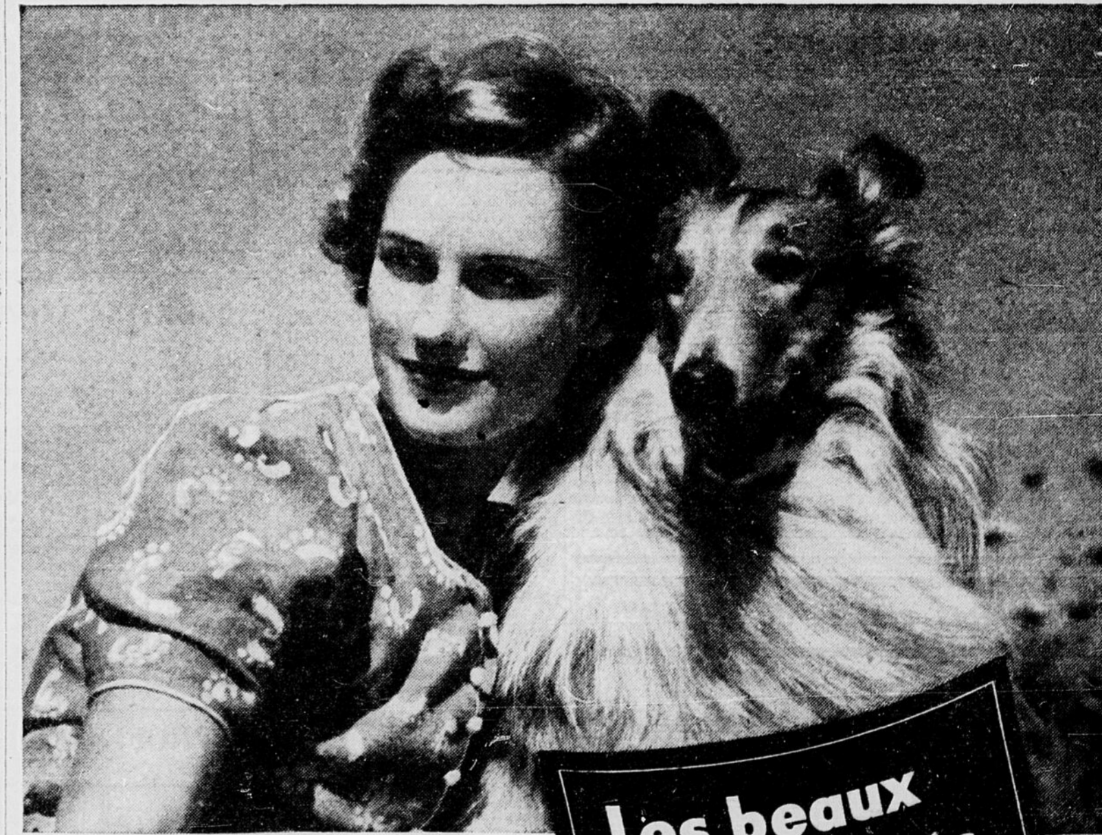
De beaux instantanés attendent d'être pris à chaque voyage... à chaque excursion. Les mots ne peuvent exprimer ce que vous voyez, ni la mémoire le retenir. Mais un Kodak fait les deux.