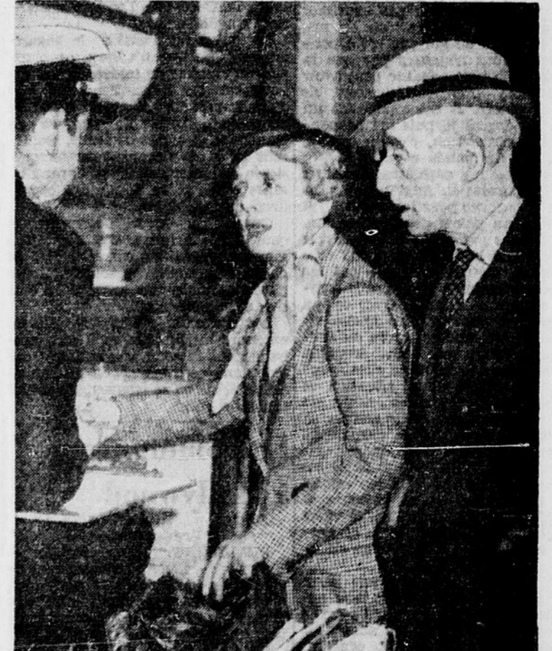
Le baron E. ROTHSCHILD et son épouse, lors de leur arrivée à New-York, ont soumis à la douane des bijoux pour une valeur de un million de dollars.