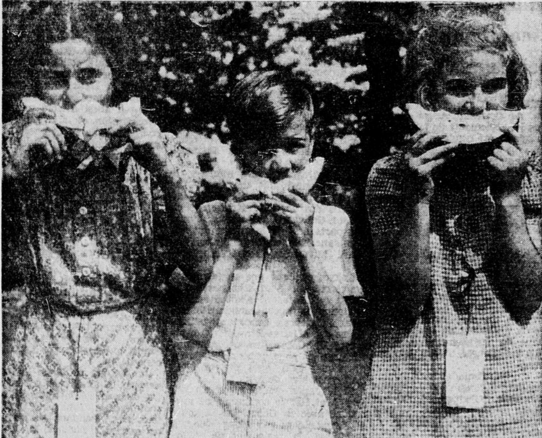
Le club d'automobile de Hamilton est le plus ancien du genre au Canada. Mais si l'on en juge par la photo ci-dessus, ses membres sont des plus modernes, lors du pique-nique annuel en faveur des petits orphelins.