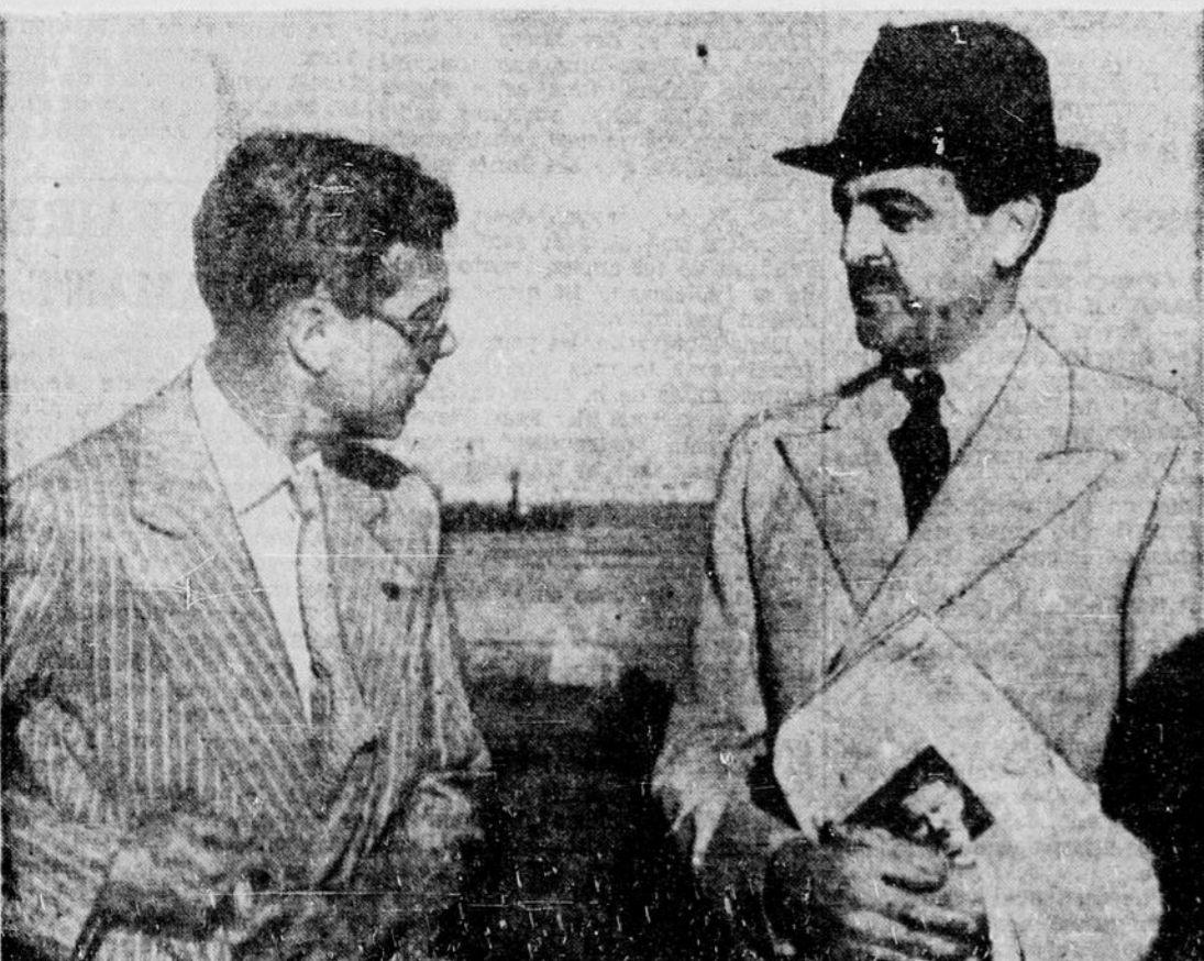
Le duc de Windsor a récemment été nommé gouverneur de l'île Bahama. On voit ici le duc causant avec le correspondant du "Times" de Londres, à Lisbonne, peu après son arrivée de France et d'Espagne.