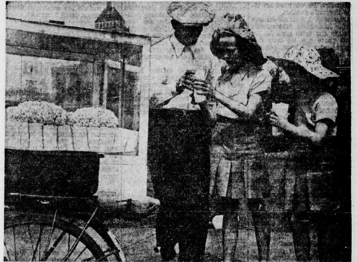
Ces deux fillettes qui ont quitté récemment la ville de Londres, s'aperçoivent, à leur grand plaisir, qu'un dix sous canadien peut leur procurer chacune un plein sac de maïs grillé. Les deux fillettes demeurent actuellement chez leur oncle à Toronto.