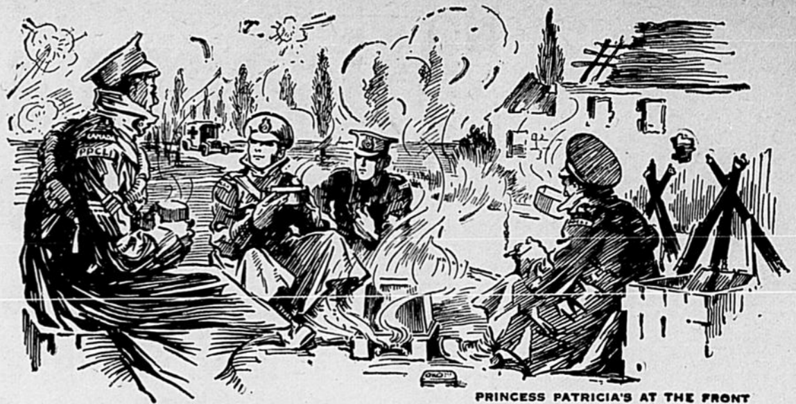
PRINCESS PATRICIA'S AT THE FRONT

A VENDRE Un moteur de 2 forces et demie. Bon marché. S'adresser au Clairon.