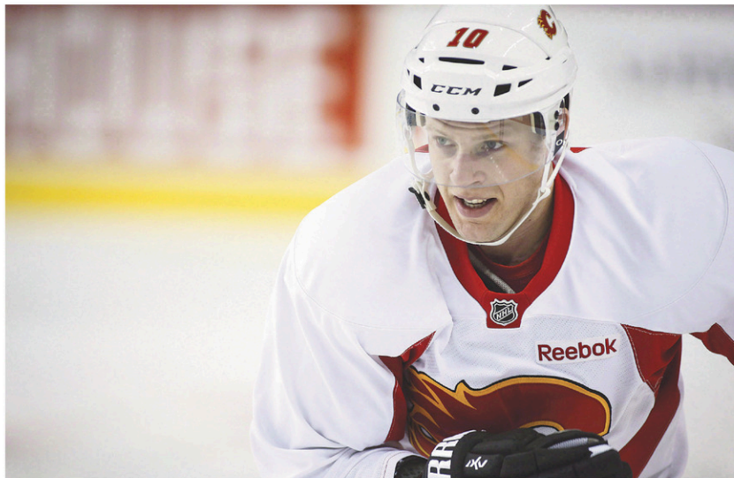
La saison dernière, Kris Versteeg, 31 ans, s'était rendu au camp des Oilers pour tenter de prolonger son parcours. Ce sont finalement les Flames qui lui avaient proposé un contrat.