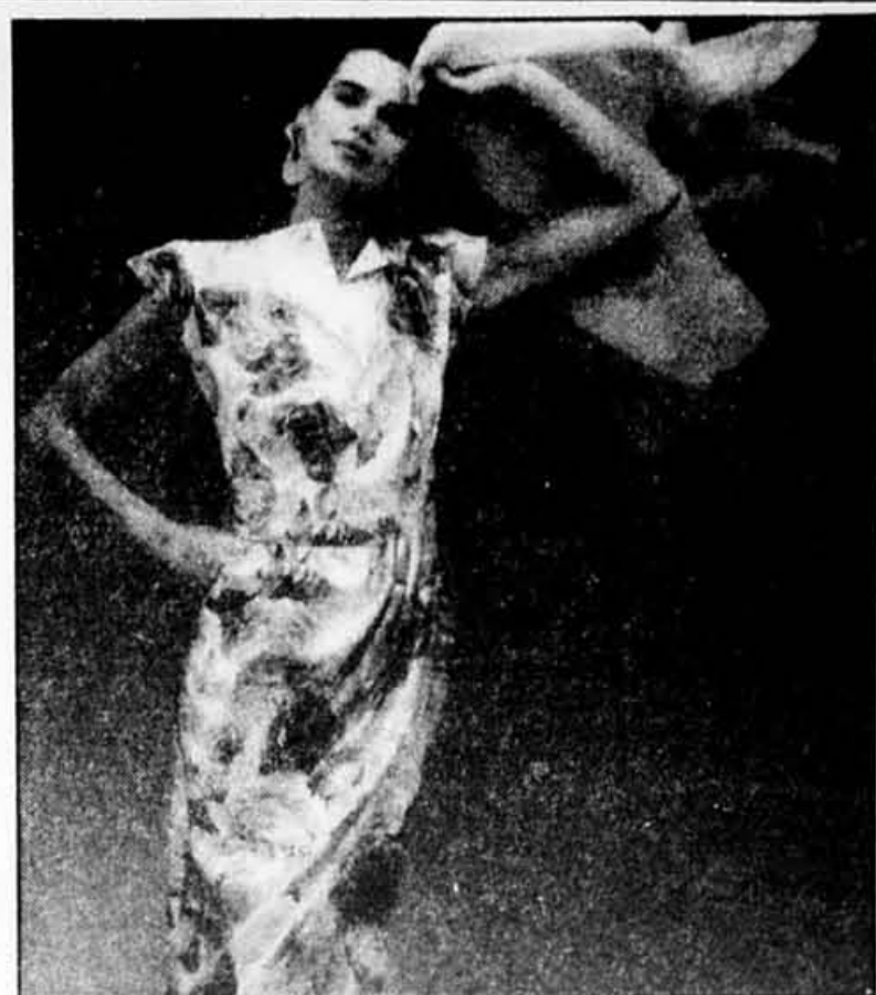
Robe en soie blanche imprimée de fleurs rouges. Mousseline jaune.