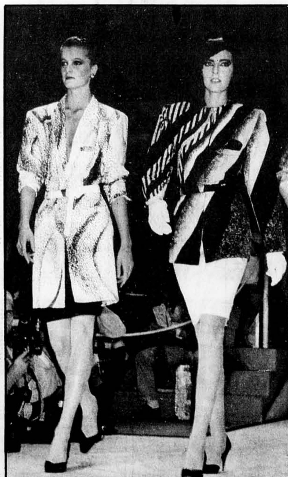
Toute une constellation, pour deux petits tailleurs qui vont bien passer l'été. De grandes lignes d'ordinateur en noir et blanc.

■ Regardez bien vos griffonnages, barbouillages et graffiti, ceux que vous faites pendant que vous parlez au téléphone. Vous les retrouverez sans doute sur les vêtements du printemps. Les dessinateurs de tissus ont décidé de s'en inspirer, de même qu'ils découvrent les dessins d'enfants — une grande naïveté est de rigueur — et les premières pages des journaux, les grands titres.