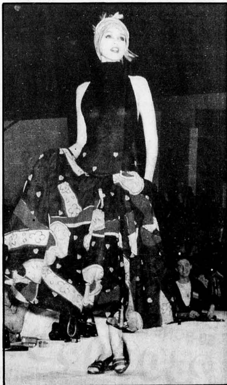
Le charme d'un corsage moulant, très collet monté, sur une jupe de gitane aux dessins d'enfant.