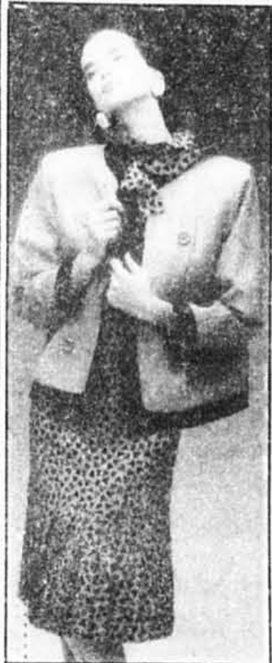
Veste en gabardine de laine verte bordée noire. Robe en soie façonnée verte imprimée noire.