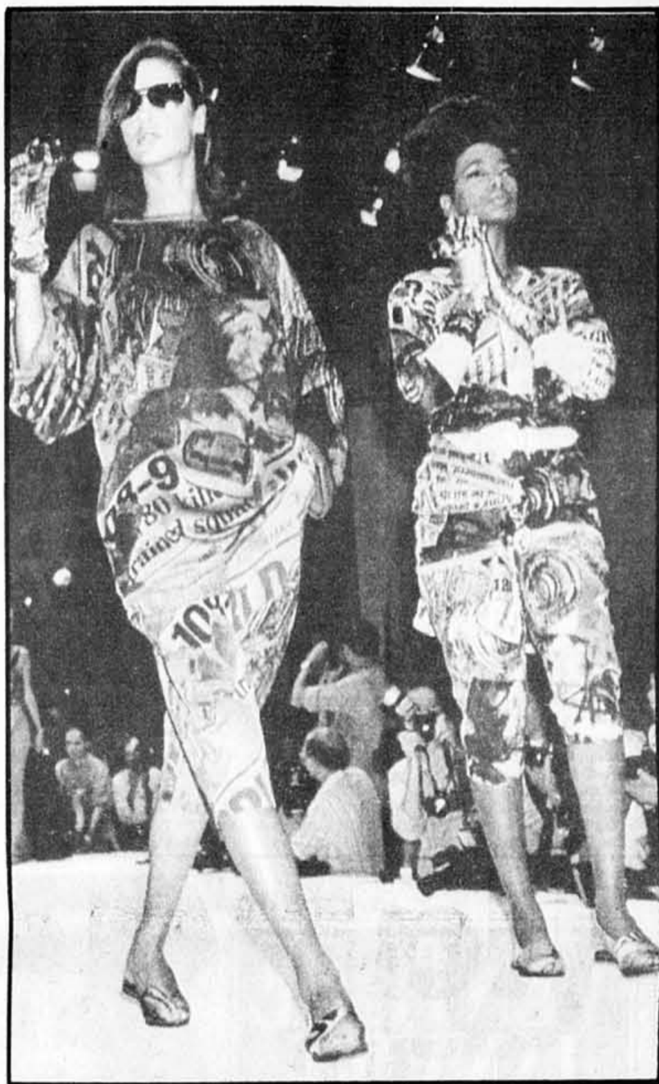
Voilà une bonne nouvelle : comment être à la « une » sans drame, simplement. Jupe étroite, pantalon de cycliste, grand tee-shirt.