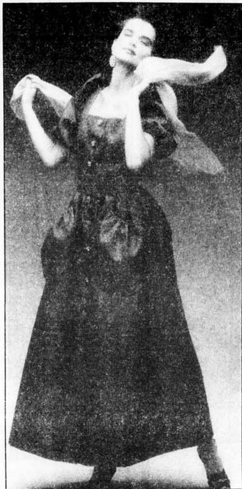
Robe longue en gazar bleu.

« La femme Ricci est moderne, dynamique et radieuse ». Du moins si l'on se reporte à la collection de prêt-à-porter printemps été 1986 de Nina Ricci Boutique.