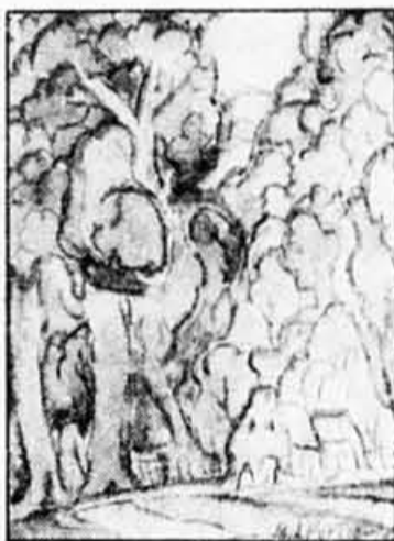
M.-A. FORTIN «STE-ROSE» Aquarelle.

à 19 h 30 — Samedi à 13 h 30 Mar. 21 jan. — Vente générale Mer. 22 jan. — Montres, horloges et bijoux Jeu. 23 jan. — Art canadien Ven. 24 jan. — Art international Sam. 25 jan. — Vente générale