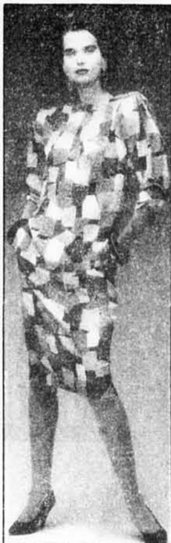
Deux pièces en soie façonnée imprimés « Art moderne » multicolore : bleu, rose, vert, jaune, rouge.

Pour le soir, on propose un ensemble pantalon de soie noire, une robe bleu gazar ou encore des robes « débutantes » en organdi blanc et coton piqué ou encore en taffetas somptueux.