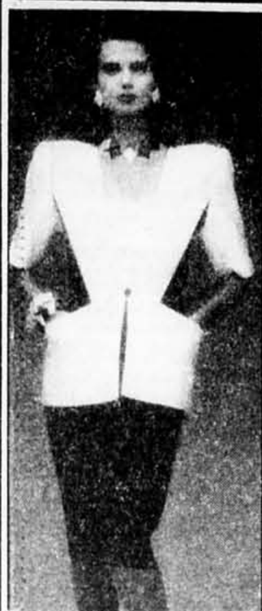
Veste en toile bicolore noir et blanc. Robe bustier assortie.