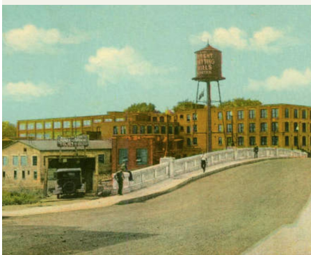
Regent Knitting Mills à Saint-Jérôme

Il y a cinquante ans, les ouvriers et ouvrières de la Regent Knitting Mills à Saint-Jérôme occupaient l'usine. Ils s'opposaient ainsi au transfert d'une partie importante de la production vers les installations montréalaises de la compagnie. Ce geste radical allait donner lieu à un cheminement collectif qui déboucha sur une expérience syndicale unique au Québec: la mise sur pied de Tricofil, une entreprise possédée et gérée par ses artisans.