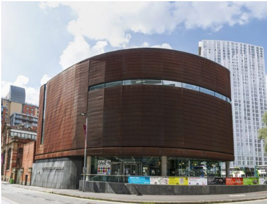
People's History Museum à Manchester

Le « People's History Museum (PHM) » à Manchester est le musée national de la démocratie dans l'histoire politique et sociale de l'Angleterre au cours des 250 dernières années. Il contient les archives du Parti travailliste et du Parti communiste, des archives des organisations de la classe