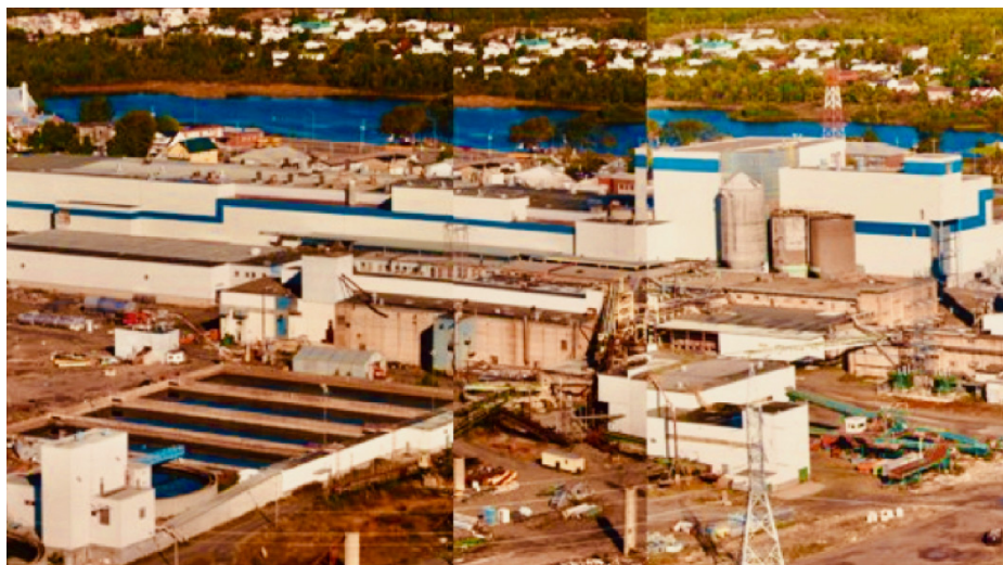
L'usine Papiers Gaspésia à Chandler en 1999

Pour avoir plus d'information, on peut consulter le site du projet à l'adresse suivante : https://deindustrialization.org/?lang=fr . À noter que les publications du CHAT (site Internet et bulletins d'information) feront régulièrement état des travaux et des activités du projet.