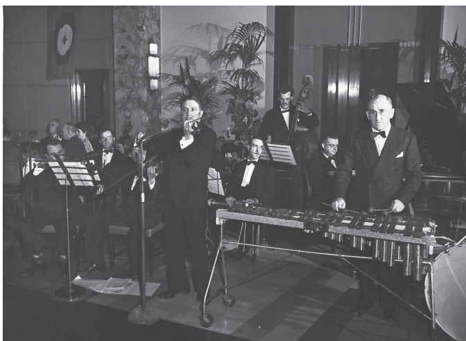
Des membres de la Guilde des musiciens, circa 1930

Les bureaux de la Guilde sont situés au 5445, avenue De Gaspé, suite 1005 à Montréal.