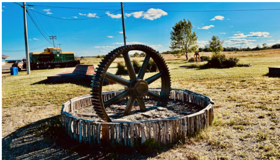
Le site de l'usine en 2022