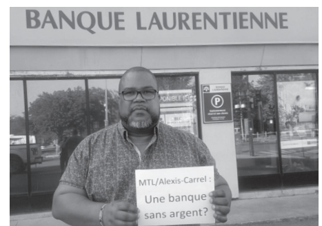
Un client appuyant la lutte du SEPB à la Banque Laurentienne en 2019 contre les coupures de postes. Ici, c'est une succursale de Rivière-des-Prairies.