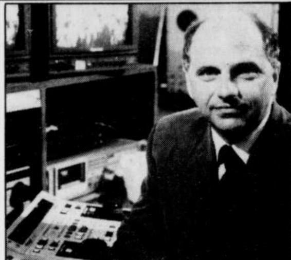
À l'émission de Claude Charron, on parle, cette semaine, des journaux à potins et des droits des couples homosexuels. LE MATCH DE LA VIE, mardi, 21h, R.-Q.