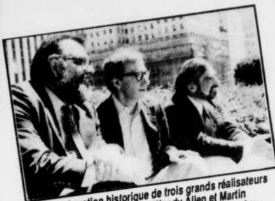
Une collaboration historique de trois grands réalisateurs de cinéma, Francis Coppola, Woody Allen et Martin Scorsese dans un film à sketches, «New York Stories». LES BEAUX DIMANCHES de Radio-Canada, à 20h.