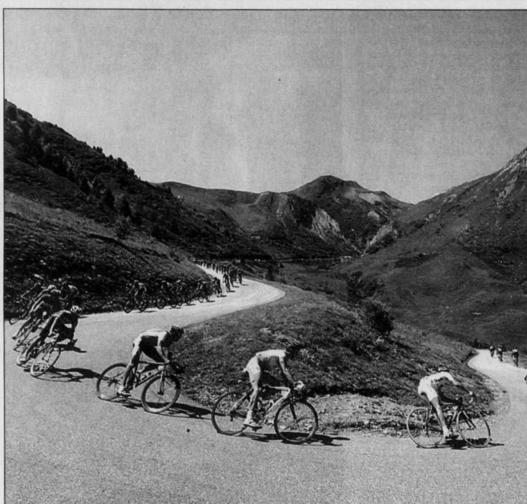
Le Tour de France portait bien son surnom de «Grande Boucle», hier, en pleine montagne.