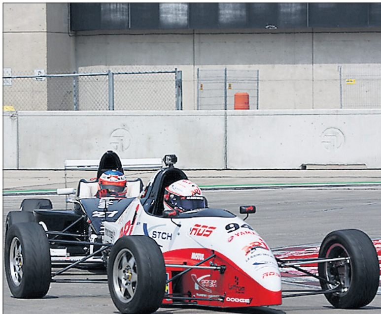
Formula Tour 1600.