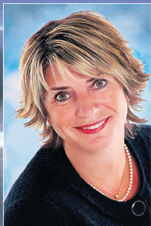
Danielle St-Amand Députée de Trois-Rivières

Soyons sur la ligne de départ du Grand Prix de Trois-Rivières, un moteur économique et touristique pour la région!