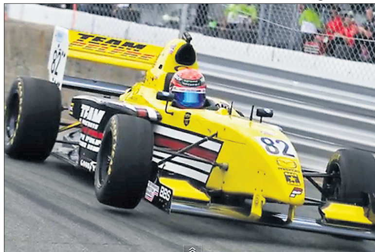
Pro Mazda Series.

C'est donc dire que la course sera disputée chaudement et qu'aucun cadeau ne se fera en piste. De plus, plusieurs pilotes québécois seront de la partie!