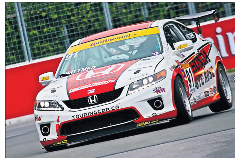
Castrol Canadian Touring.

Le tout nouveau Championnat canadien SuperCar passera ainsi par la porte Duplessis lors de sa saison inaugurale l'été prochain. Mettant en vedette des versions toutes contemporaines de voitures ayant marqué l'histoire du GP3R comme les Porsche 911, les Chevrolet