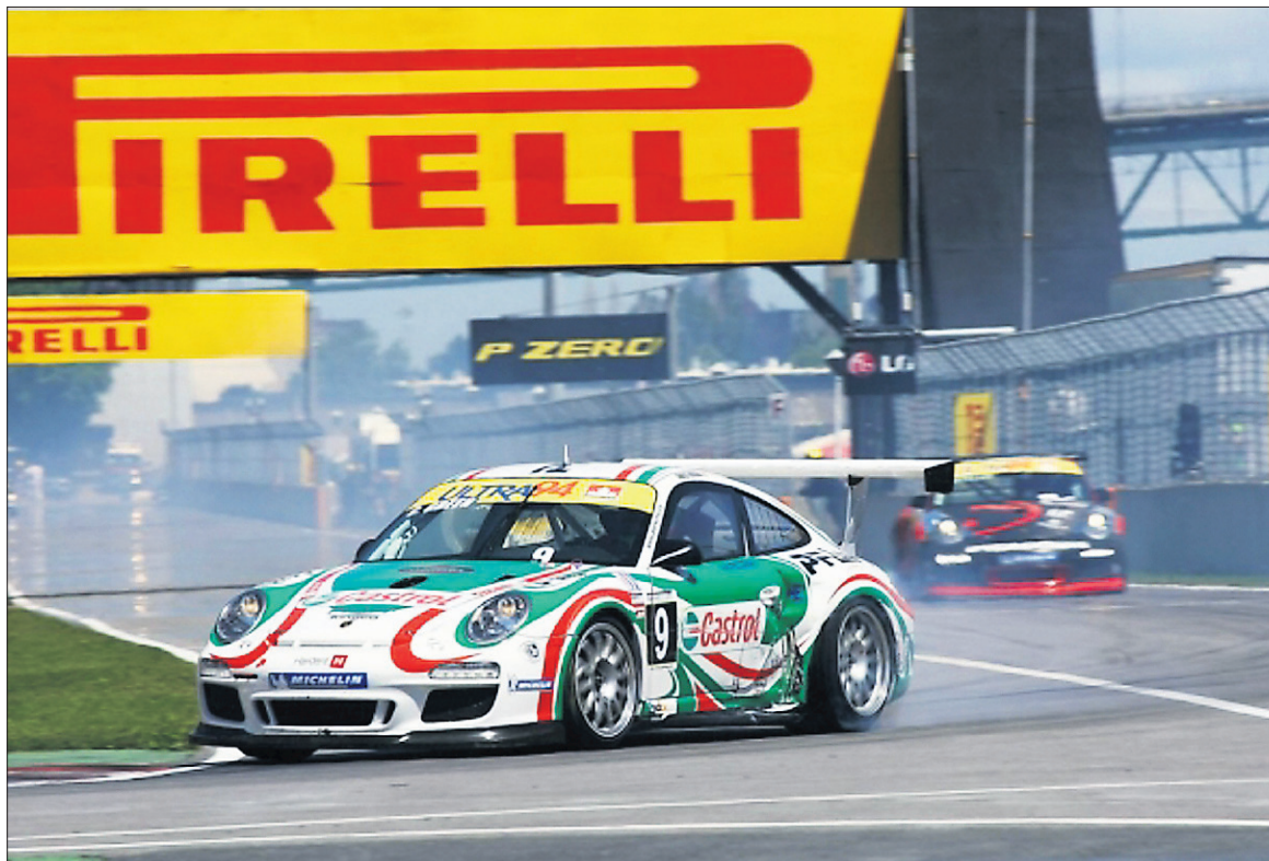
Coupe Canada Challenge Porsche GT3.

La Coupe Canada Challenge Porsche GT3 présentée par Michelin mettra aux prises à Trois-Rivières quelques unes des 2300 Porsche 911 construites spécifiquement pour la course, des Porsche identiques à celles qui se disputent la victoire dans une vingtaine de pays à travers le monde et qui accompagnent les F-1 lors de dix Grand Prix du championnat du monde FIA. Avec une liste d'inscrits sans cesse croissante et une parité mécanique découlant des règles harmonisées partout dans le monde par Porsche Motorsport, les deux épreuves au programme du GP3R de 2013 donneront un spectacle assuré.