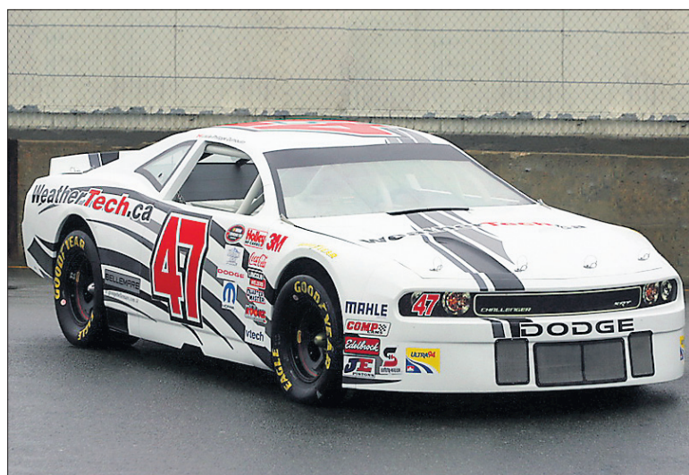
Nascar Canadian Tire.

Cette division de NASCAR est l'antichambre canadienne des séries Sprint Cup et Nationwide. Cette série est principalement composée de Pontiac G6, Ford