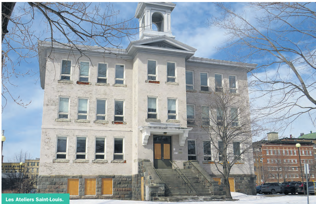
Les Ateliers Saint-Louis.

S'il n'est pas dans les plans de la Ville de subventionner un projet, elle ne ferme pas pour autant la porte à la possibilité de vendre le bâtiment et le terrain pour 1$. «C'est quelque chose qui pourrait être encore sur la table, si effectivement il y a une réhabilitation complète qui est faite de l'intérieur et de l'extérieur et qu'elle est faite sur des bases de protection et de réhabilitation patrimoniale, mais à la lumière de ce que nous avons vu depuis deux ans, ce n'est pas l'avenue à laquelle on s'attend.»