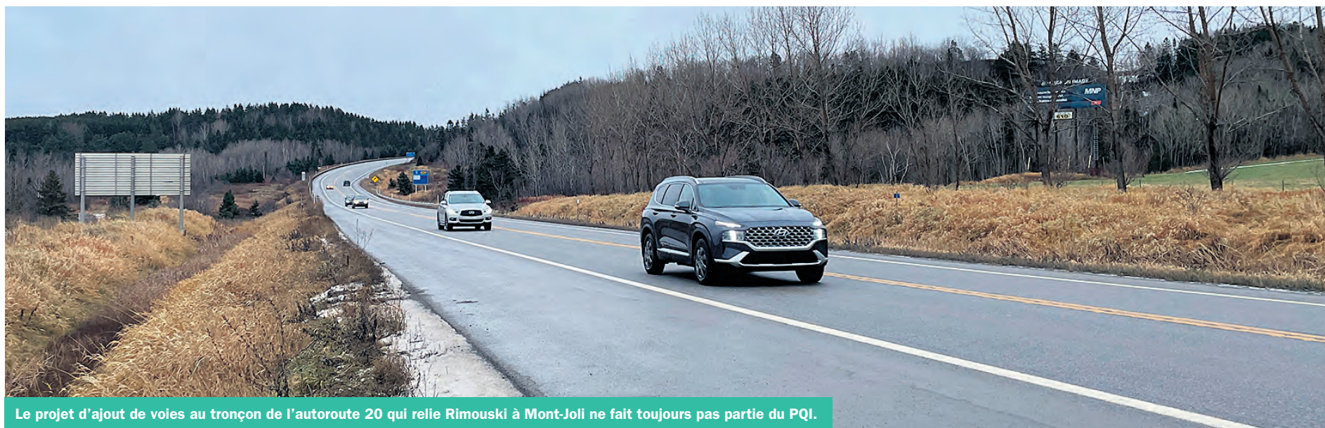
Le projet d'ajout de voies au tronçon de l'autoroute 20 qui relie Rimouski à Mont-Joli ne fait toujours pas partie du PQI.