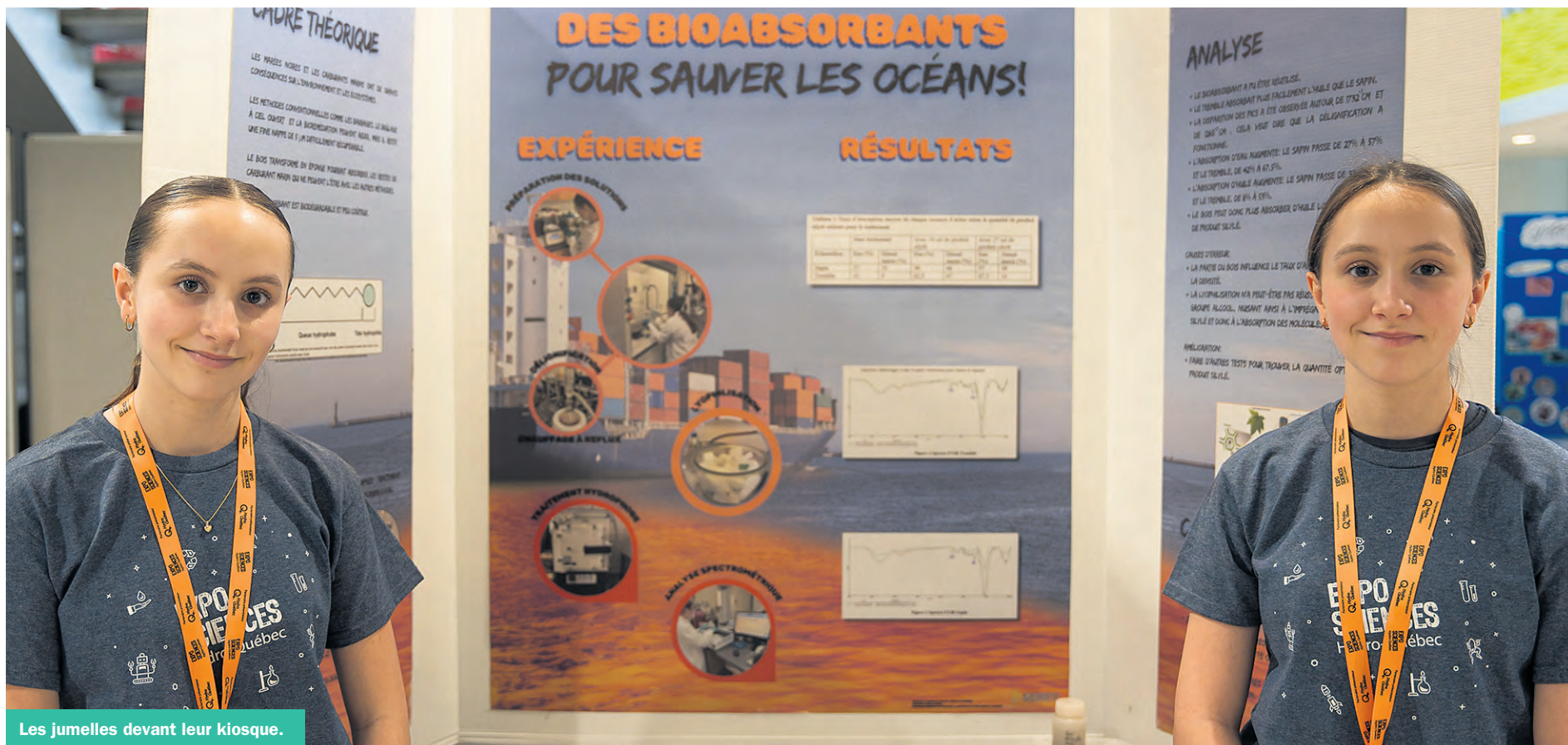
Les jumelles devant leur kiosque.