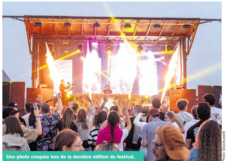
Une photo croquée lors de la dernière édition du festival.