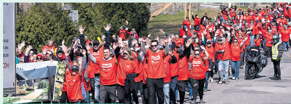
Des participants au 17 e Marchethon de la dignité.

Pour le Marchethon de la dignité, 50 ambassadeurs doivent amasser un minimum de 1200$. Jusqu'à mainte-