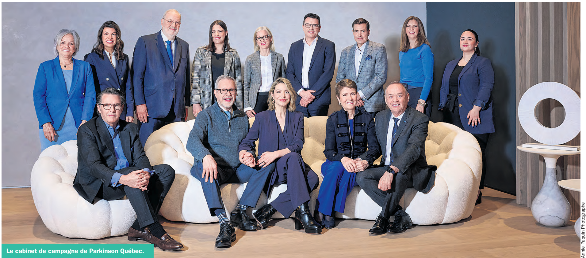
Le cabinet de campagne de Parkinson Québec.