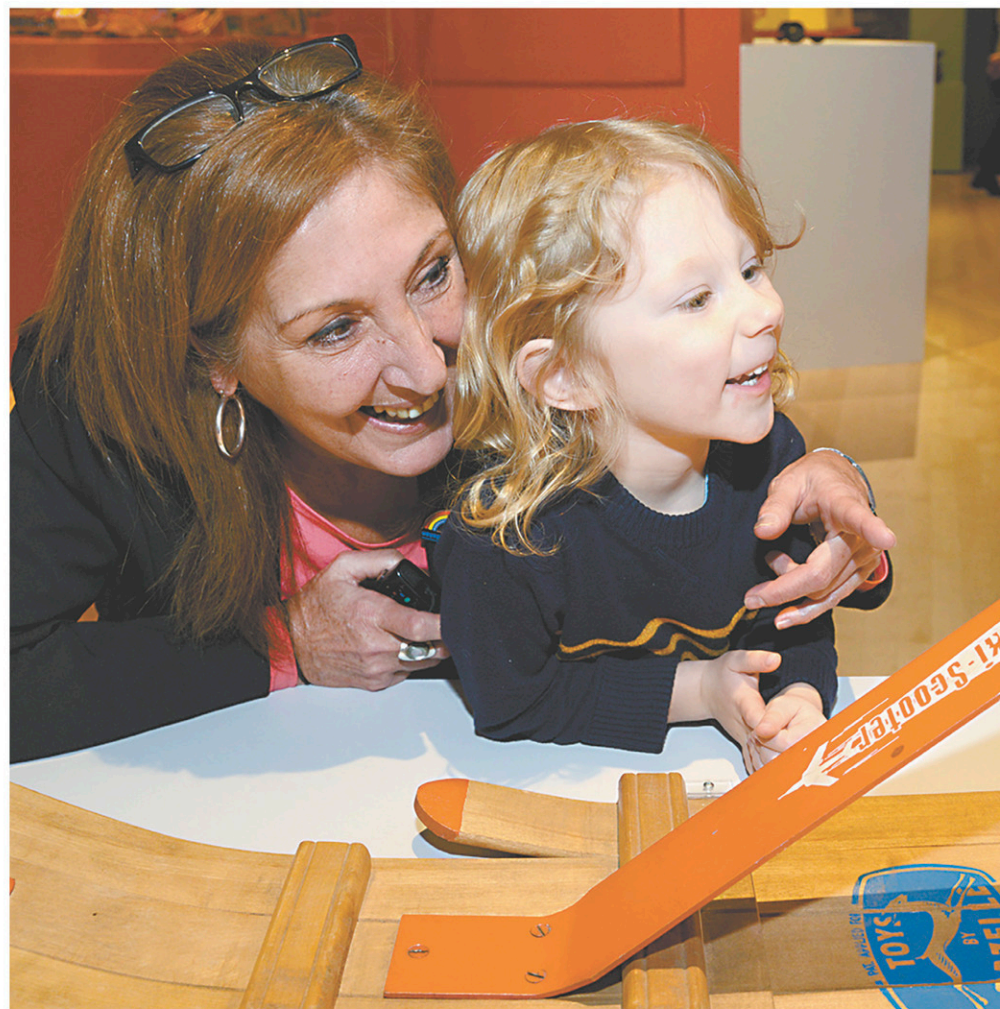
Au Musée de la culture populaire du Québec à Trois-Rivières, on propose une activité intergénérationnelle, Les bébelles de Papi et Mamie .

Les convives auront l'occasion de visiter la salle emblématique du musée dédiée à l'histoire canadienne. Cette exposition retrace l'histoire du Canada à travers ses personnages phares et les courants déterminants qui ont marqué la construction du pays.