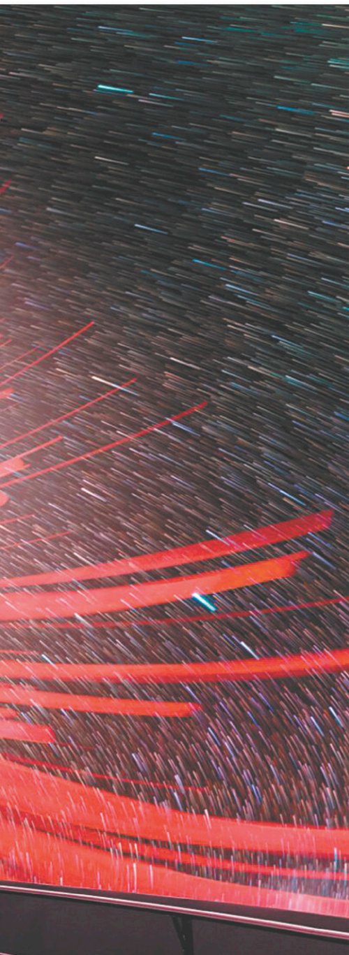
Le gros des activités d'Espace pour la vie, cette saison des Fêtes, sera concentré au Planétarium.