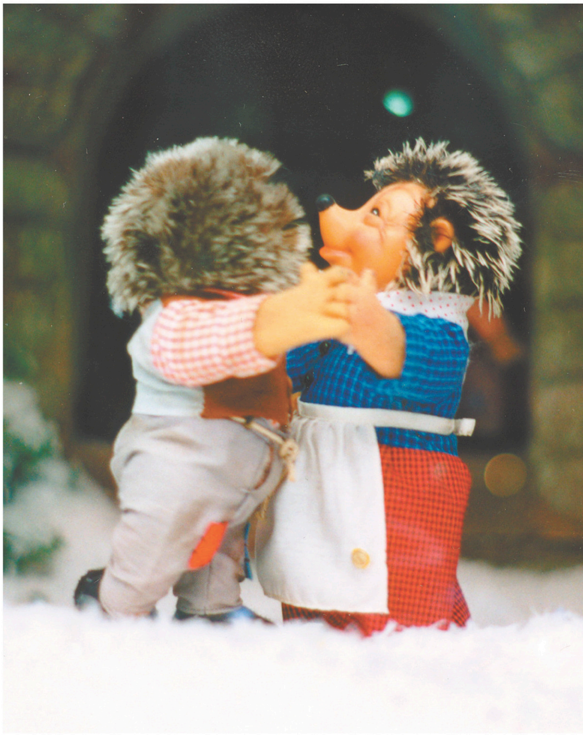
Conçues sur mesure par un fabricant de jouets allemand en 1947, les vitrines mécaniques de La Maison Ogilvy, léguées en mars 2018 au Musée McCord, mettent en vedette de petits animaux en plein décor bavarois.