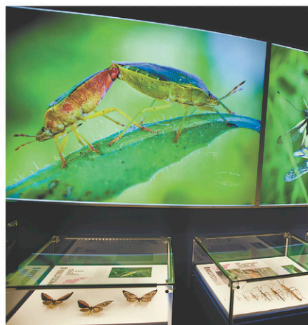
L'exposition Nous, les insectes à l'Insectarium