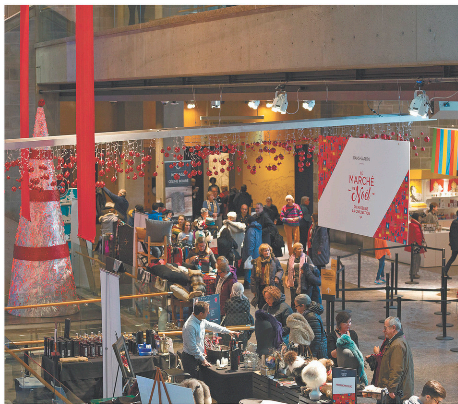
Grâce à la trentaine d'exposants présents sur place, le magasinage des Fêtes n'est plus une corvée.

L'exposition Sortir de sa réserve propose quant à elle un aperçu de ce qui se cache dans les caves de l'institution. On a sélectionné quelques-unes des 225 000 pièces de la collection pour montrer à quel point un objet peut raconter une histoire et générer une émotion.