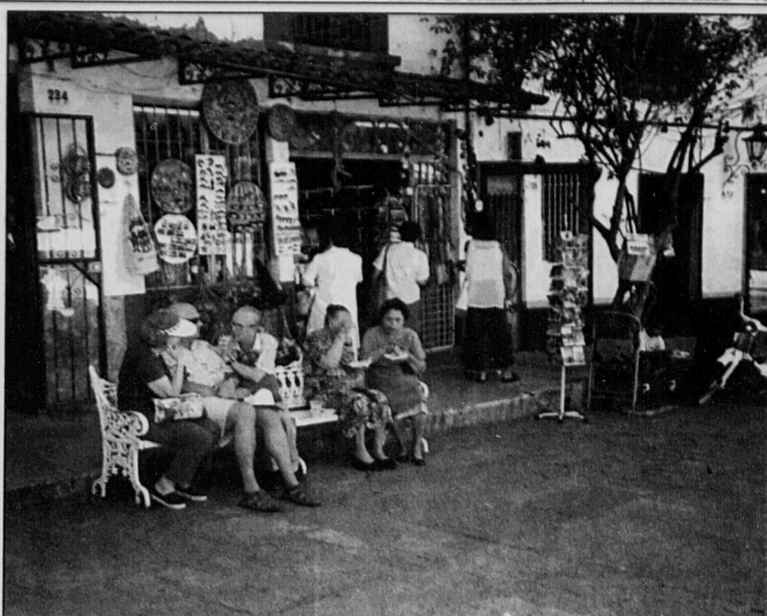
Le Mexique authentique, dirait le Routard.