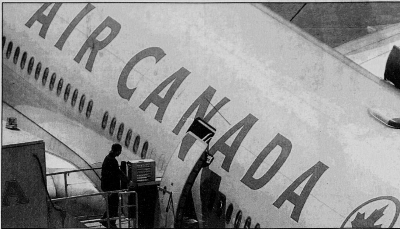
Afin d'accroître la sécurité à bord de ses vols au cours de la période des Fêtes, la société Air Canada vient d'émettre une série de conseils à l'attention de ses usagers.

- Certains jouets et la plupart des articles de sport doivent être enregistrés. Vous pouvez transporter des armes jouets dans vos bagages enregistrés, mais pas dans vos bagages de cabine. Vous devez également enregistrer l'équipement de sport comme les queues de billard et les bâtons de hockey, de baseball, de ski ou de golf.