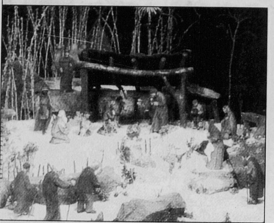
Quelque 300 crèches exécutées par leurs meilleurs artistes sont exposées à l'Oratoire Saint-Joseph