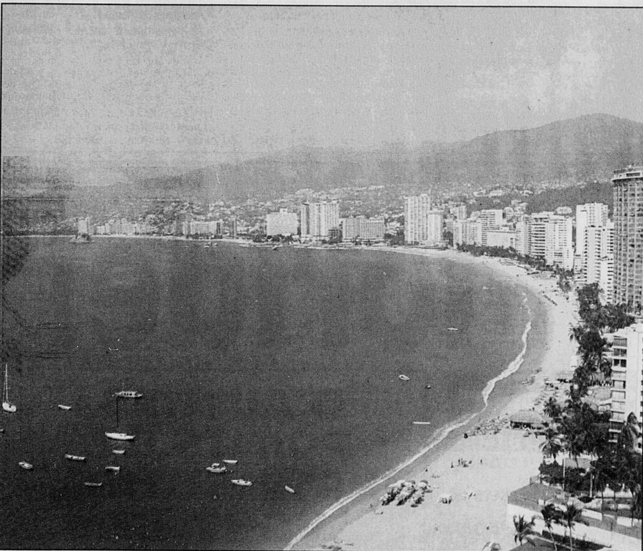
Acapulco demeure la première destination touristique du Mexique.