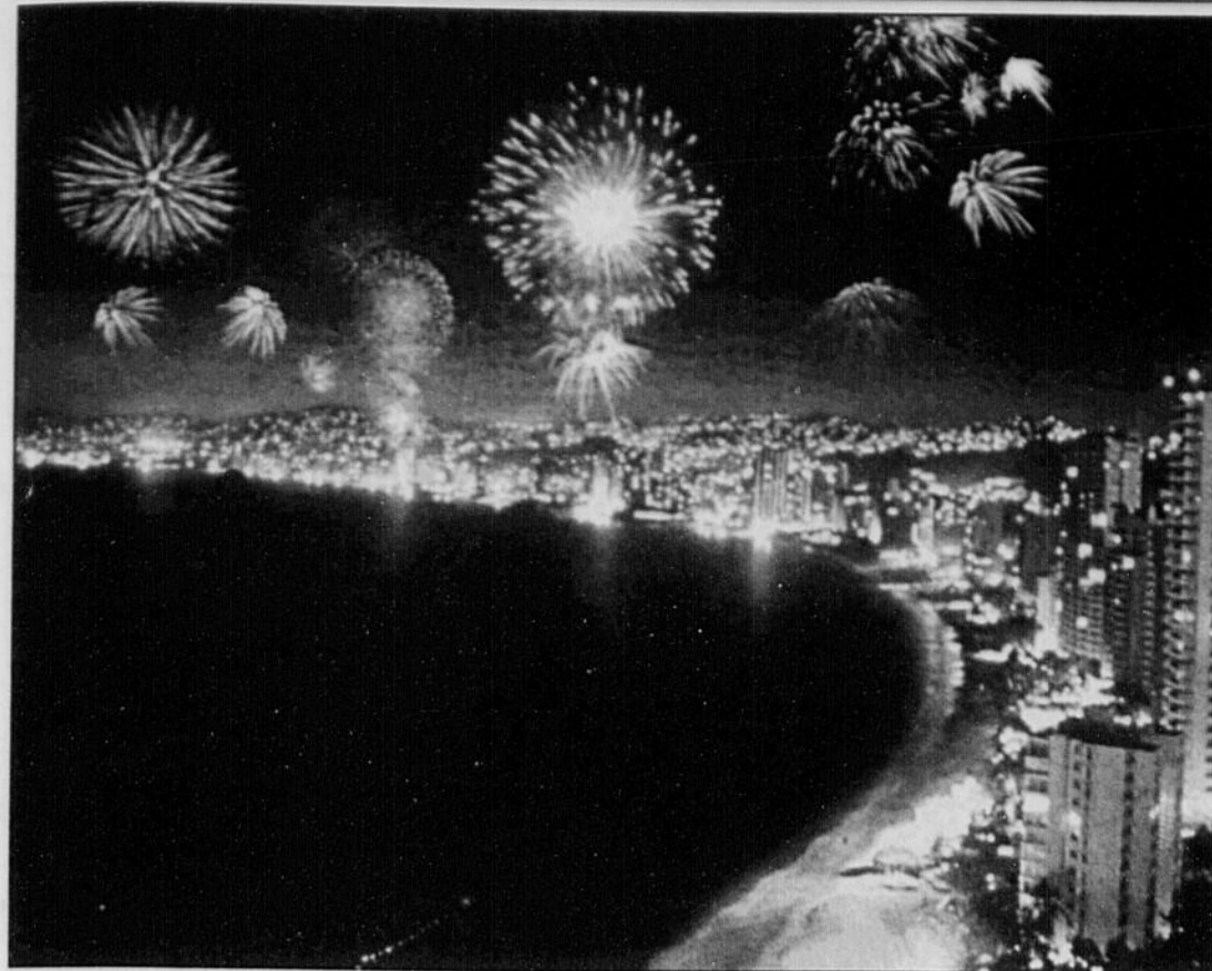
Acapulco, ce sont les plaisirs de la plage. Mais, aussi et beaucoup, ceux de la nuit.