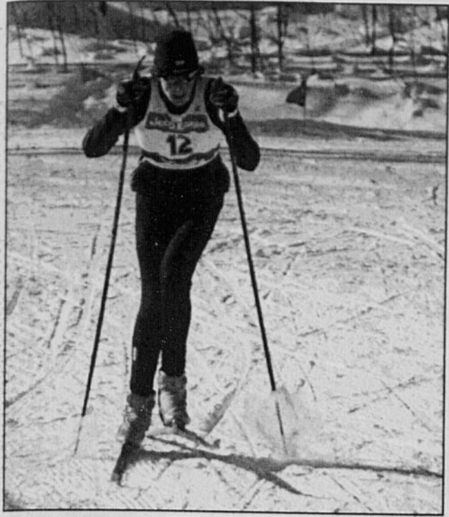
Une heure de ski de fond à 15km/h «coûte» deux fois plus en énergie qu'une heure de tennis.