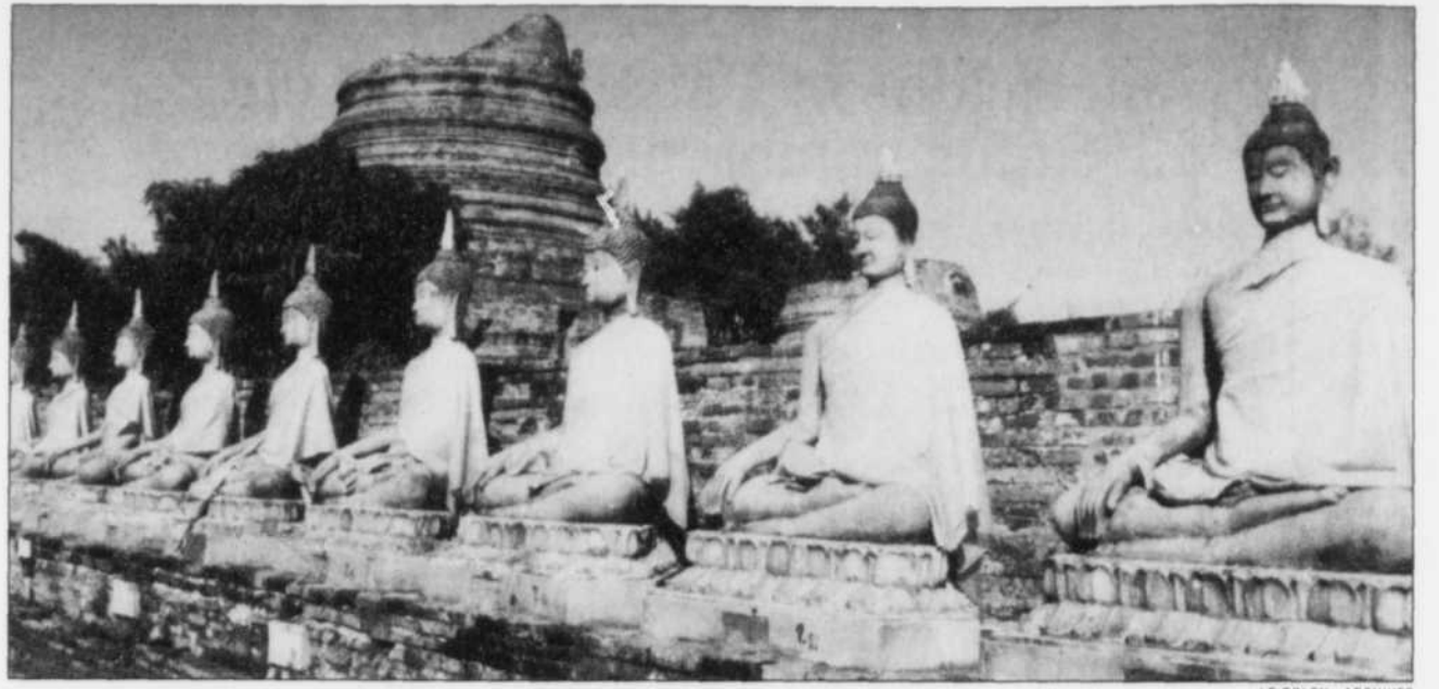
Le nouvel attrait de la Thaïlande risque de détourner les touristes européens et américains d'autres régions.

me (OMT) table ainsi sur une hausse de 12,5 % du nombre de touristes européens et de 15 % de celui en provenance des Amériques dans la zone pacifique est-asiatique en 1998.