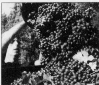
Septembre, le temps des vendanges dans le Sud-Ouest. Saint-Cirq-Lapopie (à droite): un village hors du temps.