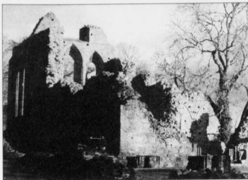
Les ruines d'une église, en Irlande du Nord.

L'Europe de l'Ouest a bénéficié d'un regain d'intérêt (+12%) et a représenté 80% des voyages tandis que l'Amérique du Nord n'a constaté