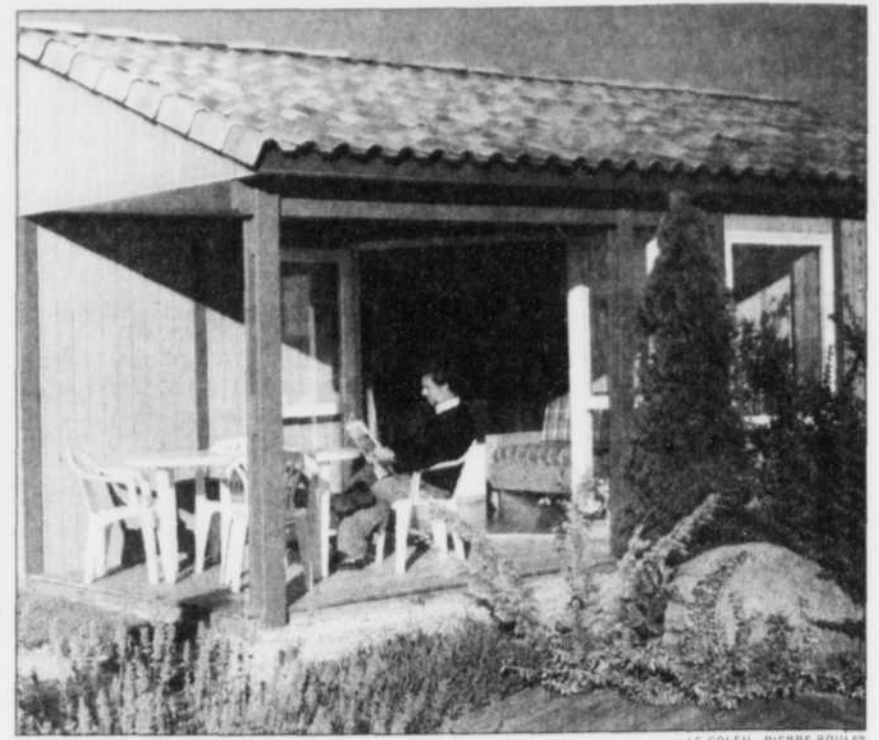
Chaque unité comprend généralement une salle commune (avec divan-lit), une chambre avec lit double et une autre avec lits jumeaux, de même que douche et toilettes.

On parle ici de voyage en « classe économique »: 169 $ pour trois nuits, 229 $ pour quatre et 398 $ pour sept... peu importe le nombre d'occupants. Dépendamment des endroits, il faudra prévoir un supplément de 40 francs (10 $) pour la literie et les ser-