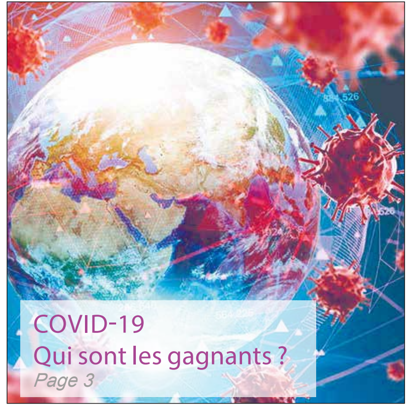
COVID-19 Qui sont les gagnants ? Page 3