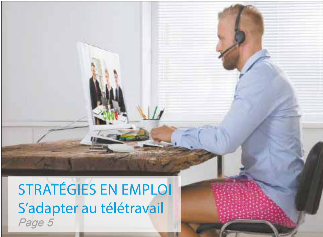
STRATÉGIES EN EMPLOI S'adapter au télétravail Page 5