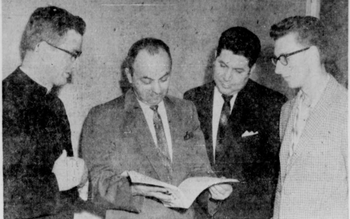
Ralliement ouvrier à Way's Mill