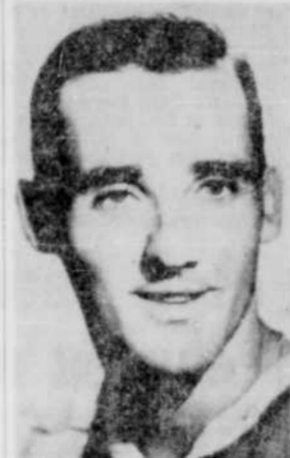
Jacques Plante En vedette

Dans la troisième reprise, les compteurs des Canadiens furent Boom Boom Geoffrion, Henri Richard, Claude Provost, Don Marshall et Bobby Rousseau. Murray Balfour a empêché