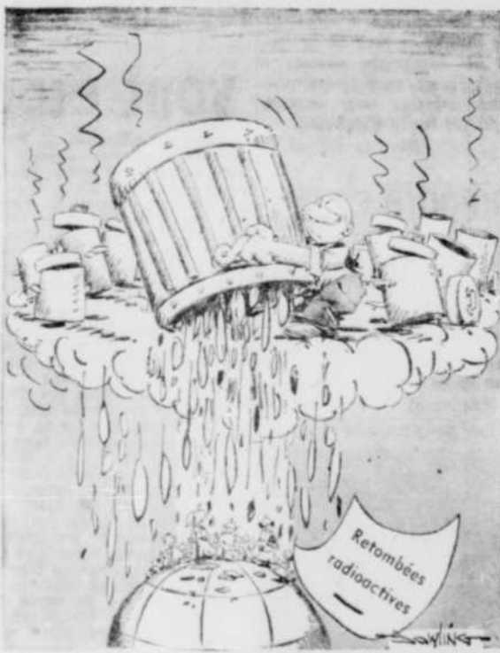
Les vidanges de M. Khrouchtchev

Un mensonge flagrant C'est un mensonge flagrant que de dire que notre consentement à négocier vient de notre faiblesse et de notre irresolution. Elle vient plutôt de ce que nous comprenons que la seule façon concevable de protéger Berlin-Ouest, d'amener un développement bien ordonné de toute l'Allemagne et d'assurer la sécurité de l'Europe centrale, c'est de négocier avec l'Union soviétique. L'Alliance occidentale ne saurait attendre ses objectifs par la guerre, qui détruirait toute l'Europe. Elle ne saurait le faire non plus par des menaces ou de l'ébrouffie, ni en entretenant l'illusion qu'en faisant suffisamment d'esbrouffe, Khrouchtchev prendra ces rododendons pour argent comptant et lèvera les mains en signe de capitulation.