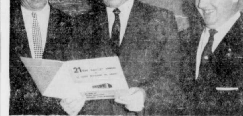
Elections à la Caisse populaire de Granby. — Lors de son assemblée annuelle, la Caisse populaire de Granby a procédé à différentes élections dans les conseils et commissions d'administration.