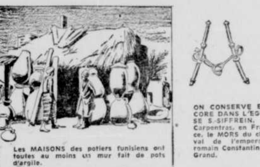
ON CONSERVE ENCORE DANS L'EGLE... Les MAISONS des potiers tunisiens ont toutes au moins un mur fait de pots d'argile.