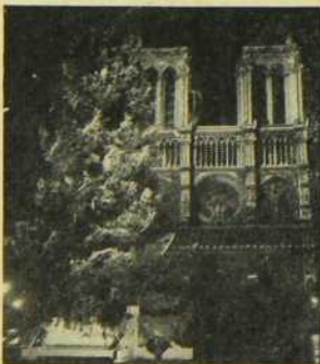
VOTRE PROCHAIN NOEL A PARIS