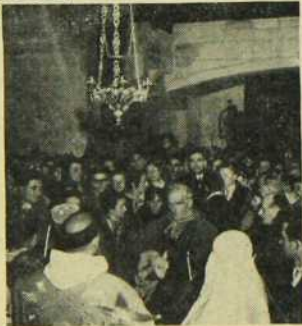
LA MESSE DE MINUIT BAUX EN PROVENCE