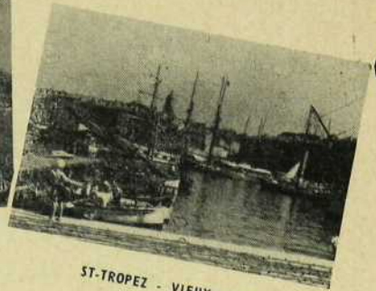
ST-TROPEZ - VIEUX PORT