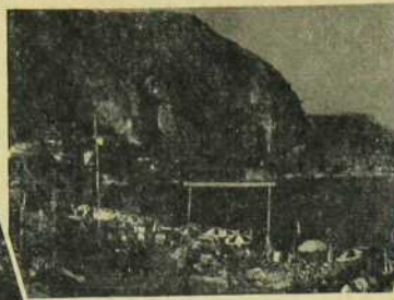
COTE D'AZUR - CAP D'AIL