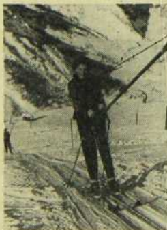
VAL D'ISERE SPORT D'HIVER

La France vous offre de bons lieux de repos et de divertissements pen- dant la saison d'hiver.