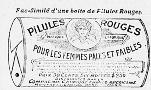
Fac-Similé d'une boîte de Pilules Rouges.