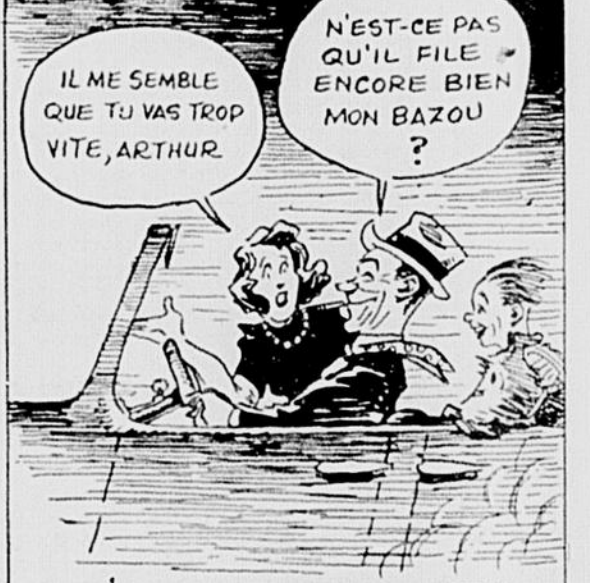
ET UNE FOIS SUR LE BOULEVARD, TU NE PEUX RÉSISTER AU DESIR D'APPUYER UN PEU SUR L'ACCELERATEUR... MAIS AU MOMENT OU TU TOUCHES GO