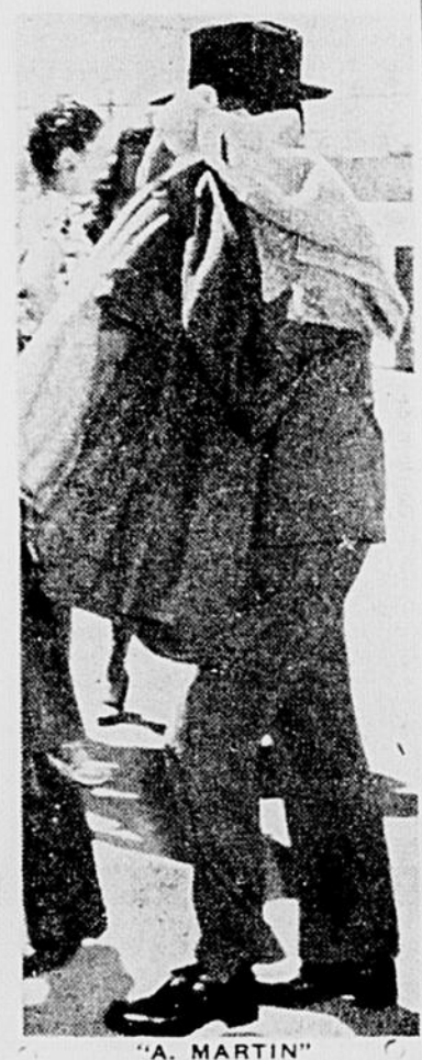
"A. MARTIN" ... his luggage gave him away.