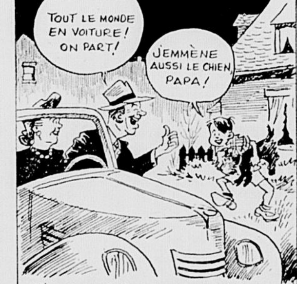
T'AS PAS DÉJÀ PRIS LA ROUTE AVEC TOUTE TA FAMILLE POUR UNE PROMENADE DOMINICALE DANS TA BAGNOLE...