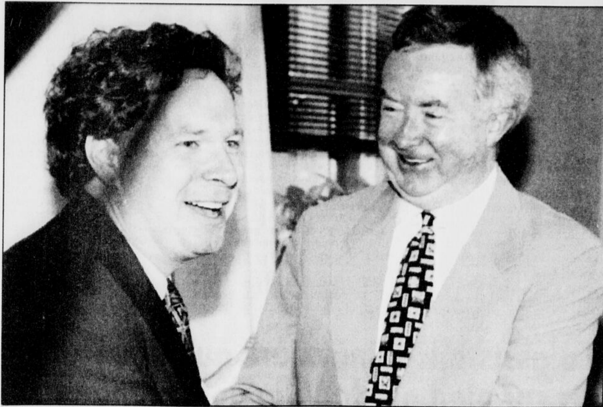
Le candidat Jean Charest était heureux hier de recevoir l'appui du ministre des Affaires constitutionnelles, Joe Clark. Al'approche du congrès à la direction, tous les appuis comptent dans la perspective d'une lutte serrée.

Le gouvernement fédéral a annoncé en 1990 qu'il réduisait unilatéralement les sommes redistribuées aux provinces et destinées au financement des soins de santé et de l'éducation. Il a aussi limité sa participation au programme d'assistance sociale des trois plus riches provinces.