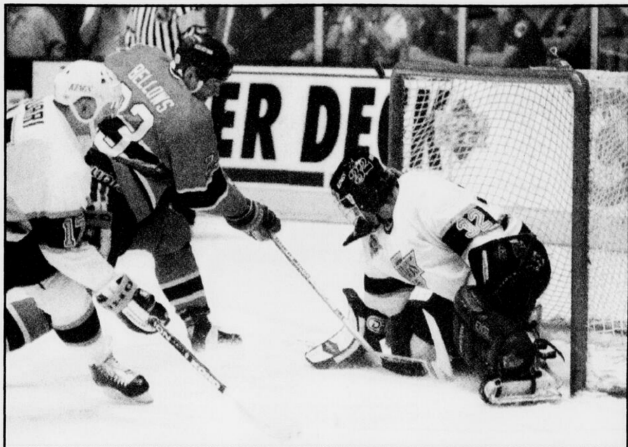
Kelly Hrudey a fermé la porte devant Brian Bellows, en première période. Le joueur du Canadien était talonné de près par Jari Kurri.

McSorley a créé l'égalité à cinq secondes de la fin en saisissant une passe de Wayne Gretzky qui travaillait à sa façon coutumière derrière le filet. Les Kings profitaient alors d'une punition à Brian Bellows, qui avait accroché l'excellent plongeur qu'est Kurri.