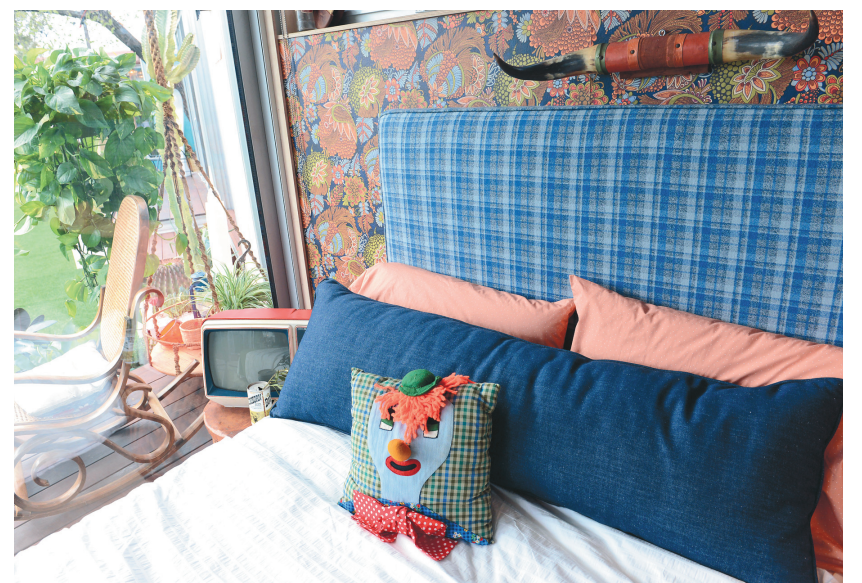
Les démarches auprès du ministère sont vaines si le zonage ne suit pas.