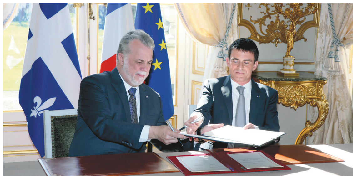
Les premiers ministres québécois, Philippe Couillard, et français, Manuel Valls, signent le « relevé de décisions » publié à l'issue de la 18 e « rencontre alternée », qui s'est tenue vendredi à Matignon.