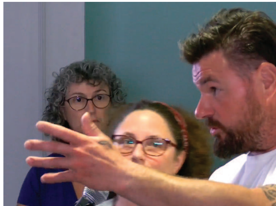
Lors de l'assemblée, il y a eu de nombreuses interventions au micro et questions sur la page Facebook.

Pour sa part, Mylène Desrosiers a renchéri sur la page Facebook: « J'aimerais m'assurer d'avoir bien compris: le conseil municipal nous indique que les propriétaires du secteur Du Moulin n'ont aucune raison de croire que la Ville pourrait