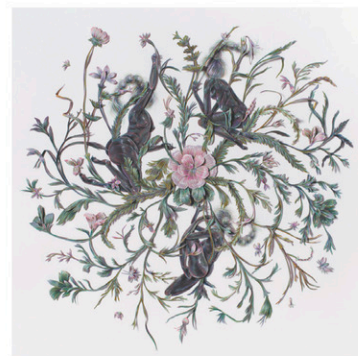
WINNIE TRUONG VIVIANEART

À ses yeux, la parité est un principe logique pour briser les abus de pouvoir. «La parité et le harcèlement, l'abus de pouvoir, sont liés. Tous les cas de harcèlement viennent