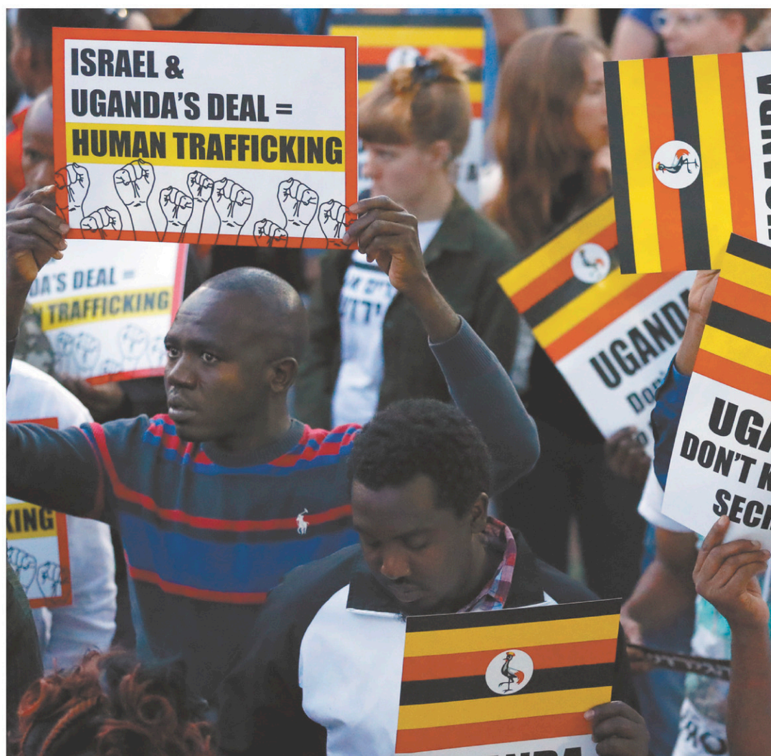
Des migrants africains manifestaient leur désaccord envers la volonté du gouvernement de Benjamin Nétanyahou de les déporter, le 9 avril dernier, dans les rues de la capitale, Tel-Aviv.