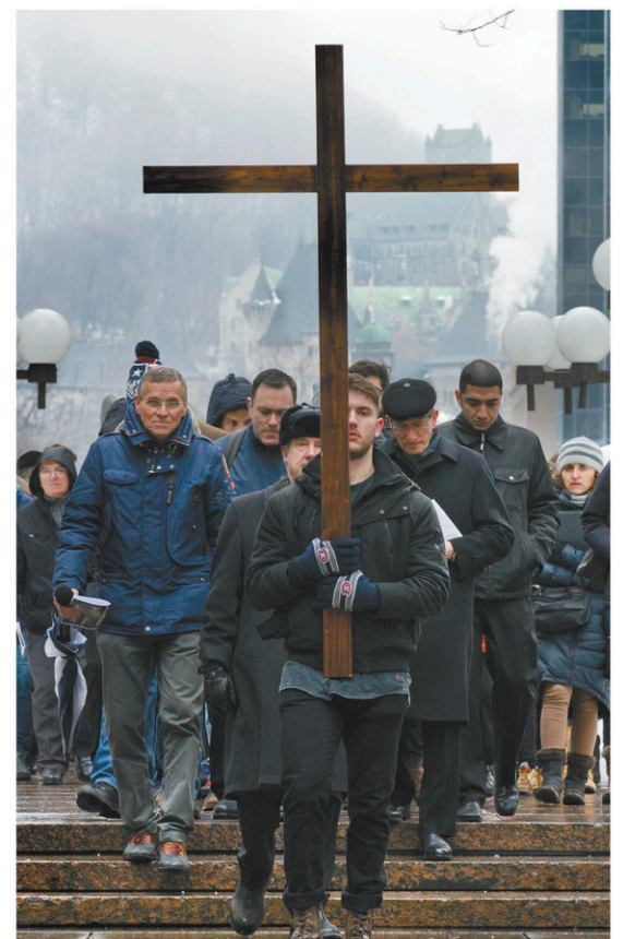
JACQUES NADEAU LE DEVOIR Dans nos sociétés occidentales actuelles, croire en Dieu ne va plus de soi.

Partisan d'un catholicisme de gauche et républicain qui combat l'idolâtrie de l'argent, qui prône le partage des richesses par l'impôt et le souci des pauvres, et qui refuse des politiques comme la gestation pour autrui et l'euthanasie — du capitalisme appliqué aux corps dont les plus faibles font les frais —, Moreau, dans une prose allègre, fluide et limpide, signe, avec ce remarquable essai, une roborative et engageante apologie du catholicisme, qui n'a pas dit son dernier mot.