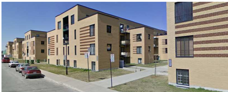
Coopérative d'habitation P'tit train de Viauville (97 log) Rue Ida Steinberg – district de Maisonneuve–Longue-Pointe