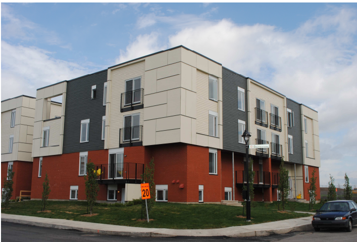
Coopérative d'habitation Cœurs vaillants – Faubourg Contrecoeur (51 log) Rue Duchesneau – district de Tétreaultville