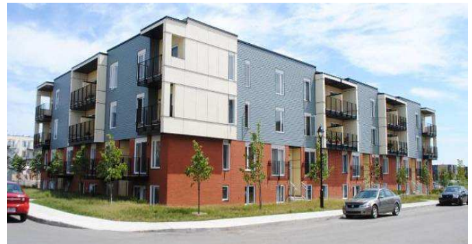
Coopérative d'habitation La Providence de Contrecoeur – Faubourg Contrecoeur (35 log) Rue Duchesneau – district de Tétreaultville