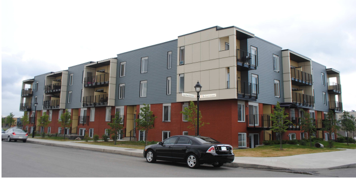
Coopérative d'habitation Au Cœur du Paradis – Faubourg Contrecoeur (35 log) Rue De Contrecoeur – district de Tétreaultville