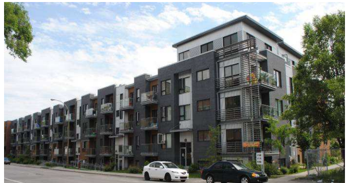
Les Habitations Loge-Accès – redéveloppement de l'îlot Viau (88 log) Rues Viau / Ontario / St-Clément – district de Maisonneuve–Longue-Pointe