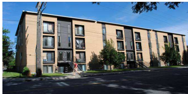
Coopérative d'habitation Main dans la main (24 log) Rue De Rouen – district de Maisonneuve–Longue-Pointe