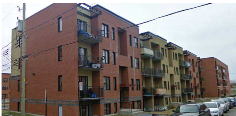
Coopérative d'habitation Hermandad – redéveloppement du site Alcatel (60 log) Rues Aubry / Souigny / Marcelle-Ferron – district de Tétéreaultville