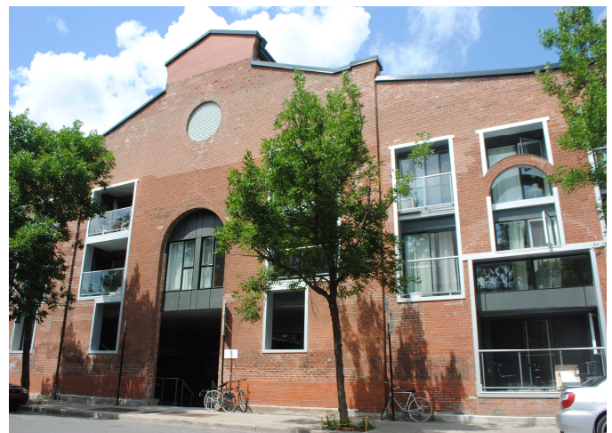
Coopérative d'habitation Station no1 – redéveloppement du site du 2100, avenue Jeanne-d'Arc (76 log) Rues Orléans et Charlemagne – district d'Hochelaga