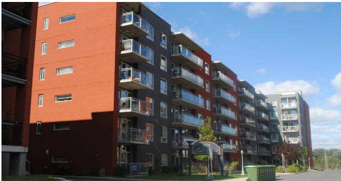
Coopérative d'habitation Émile-Nelligan – Les Cours LaFontaine (142 log) Rue Paul-David – district de Maisonneuve–Longue-Pointe