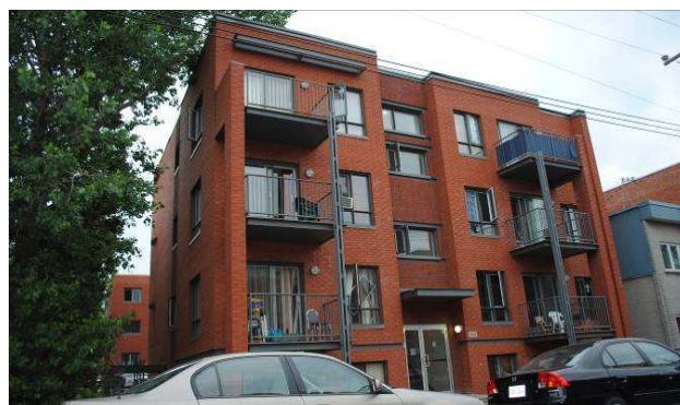
Les Habitations de la SHAPEM – redéveloppement du site Lavo (40 log) Rue Joliette – district d'Hochelega