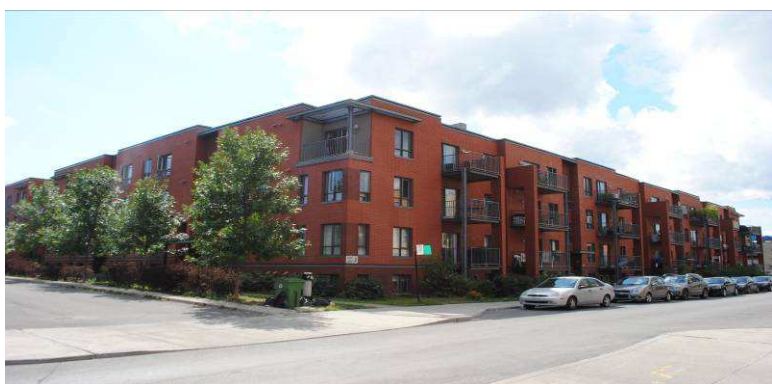
Coopérative d'habitation Jolie-Fontaine d'Hochelega – redéveloppement du site Lavo (71 log) Rues Joliette et De Chambly – district d'Hochelega