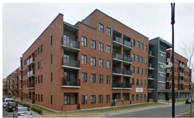
Les Toits de Mercier – redéveloppement du site Alcatel (126 log) Rue Hochelega – district de Tétéreaultville