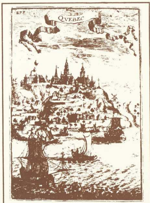
Bibliothèque Nationale du Québec