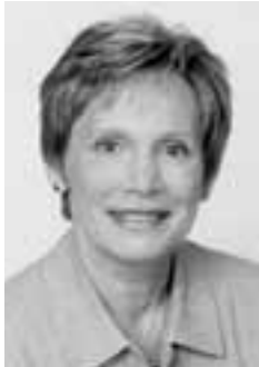
Dear Fellow Citizens,