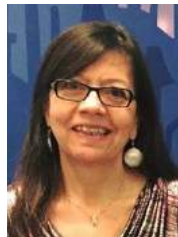
Par Elena Latrille Responsable des communications et recrutement