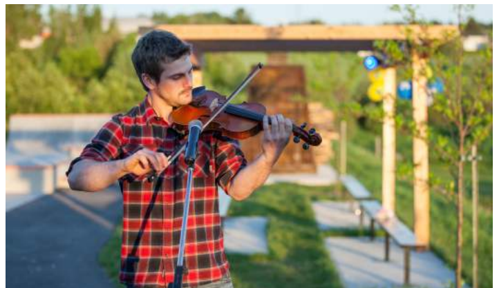
23 juin - Fête Nationale : Quelques photos de la Fête Nationale qui s'est déroulée au terrain de balle.