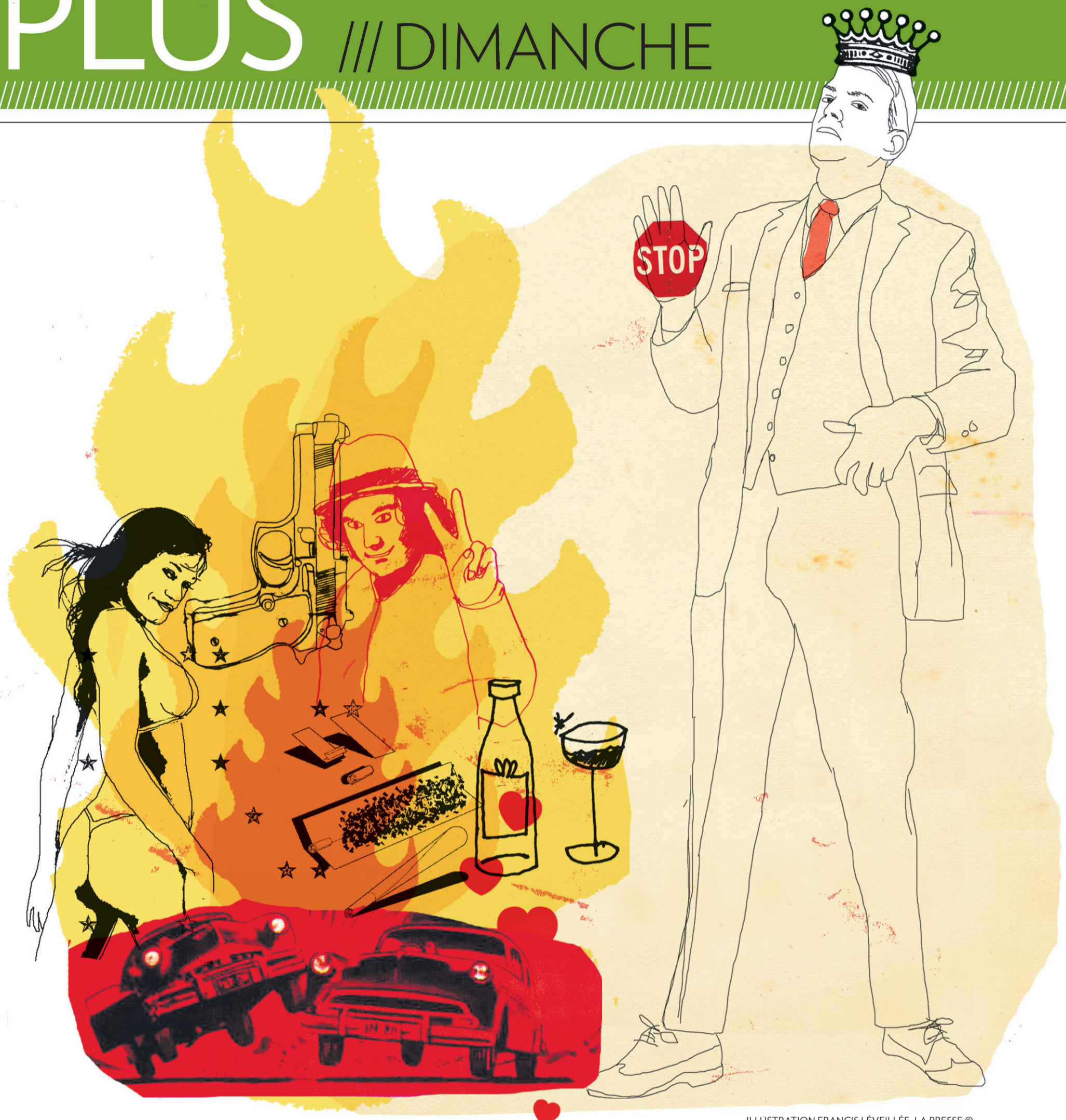
ILLUSTRATION FRANCIS LÉVEILLÉ, LA PRESSE ©