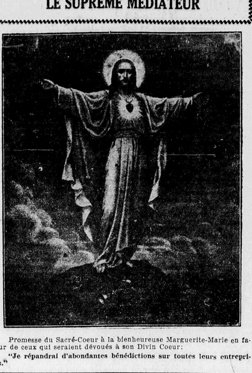
Promesse du Sacré-Coeur à la bienheureuse Marguerite-Marie en faveur de ceux qui seraient dévoués à son Divin Coeur: "Je répandrai d'abondantes bénédictions sur toutes leurs entreprises."

Pauvres êtres déçus, que la douleur tourmente, Pauvres âmes en deuil, rassurez-vous. Un jour, Après vos longs regrets, et votre longue attente, Vous trouverez encore un salutaire amour. Non, sans doute ici-bas, aucun homme n'existe, Si frappé par le sort, si faible et désolé Qui ne trouve... et peut-être à l'heure la plus triste Un ami par lequel il sera consolé.