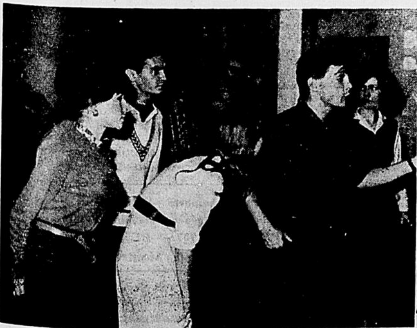
En pleine répétition...

Ne pas oublier que les étudiants ont des réductions sur présentation de leur carte de l'AGEUM. Les billets sont en vente au Centre Social à l'heure du midi et à la Comédie Canadienne.