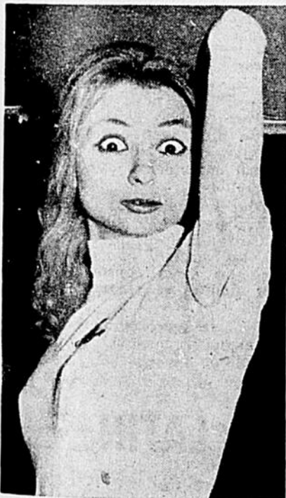
Et voilà Cocotte!

Tous ont entendu parler du succès retentissant de