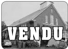
544 RTE 249, VAL JOLI ANCIENNE ÉGLISE CONVERTIE EN LOGEMENTS.