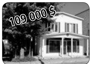
177-179 ST-GEORGES, WINDSOR LOCAL COMMERCIAL AU RDC ET 1 X 8 PCS AU 2E.