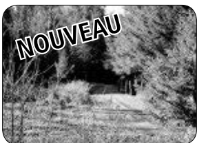
608, RANG 5, ST-CLAUDE: 55 ACRES AVEC RUISSEAU ET CASCADES