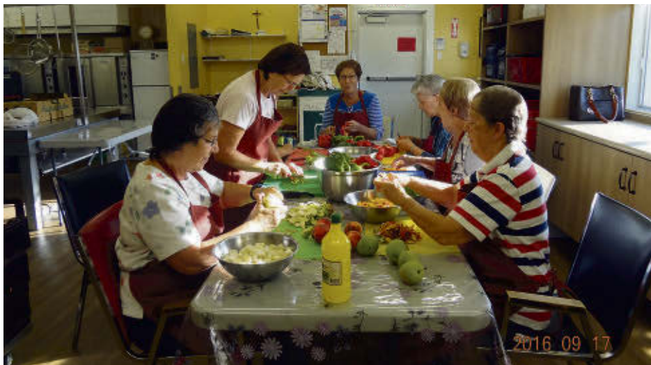
Les bénévoles de la popote roulante du CAB des Sources prennent plaisir à cuisiner pour les autres, tout en passant du temps ensemble.