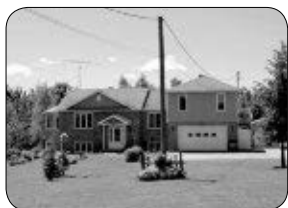
4410 ROUTE 222, ST-DENIS DE BROMPTON DUPLEX OU BI-GÉNÉRATION, TERRAIN 51,221 PC.