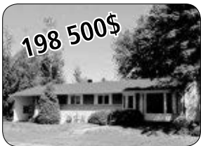
132 DES PINS, WINDSOR TOUT BRIQUE, 5 CC, TERRAIN 120 X 145'.