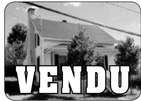
66 RUE DU MOULIN, WINDSOR CLÉ EN MAIN, RÉNOVÉ AU GOÛT DU JOUR