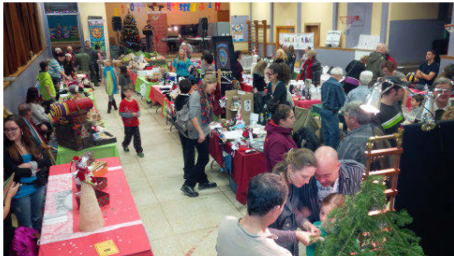
Une trentaine d'artisans seront installés dans le gymnase de l'école primaire Hamelin à Wotton.