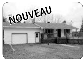
17 CORBEIL, ST-CLAUDE: PLAIN-PIED AVEC VUR SUR LE LAC BOISSONNEAULT