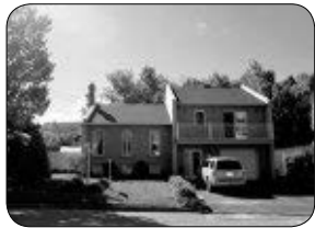
212 DES HAUTS-BOIS, WINDSOR PROPRIÉTÉ, 4 CC, TERRAIN BIEN AMÉNAGÉ.