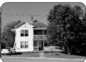
63, 6E AVENUE, WINDSOR TRIPLEX BIEN SITUÉ, 2 X 4 1/2 ET 1 X 3 1/2