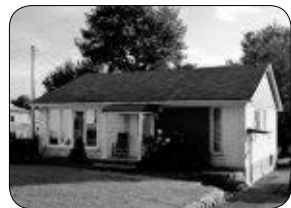
35, 2E AVENUE, WINDSOR TOUT BRIQUE, 4 CC, GRAND TERRAIN.