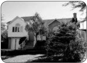
56 FRÉCHETTE, ASBESTOS MAISON À PALIERS, 2 CC, SOUS L'ÉVALUATION!