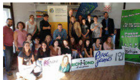
La quinzaine de participants du sixième Camp jeunes leaders accompagné des organisateurs, mentors et partenaires.