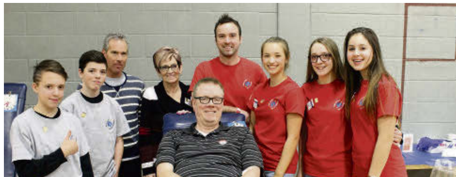
Une photo de la première collecte sur laquelle apparaissent élèves, professeurs et une membre des Filles d'Isabelle qui seront présentes lors de la collecte.