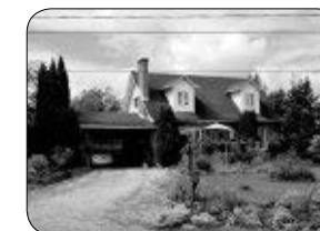
9 LE HAMEAU, ST-FRANÇOIS DE STYLE CHAMPÊTRE, 4 CC.