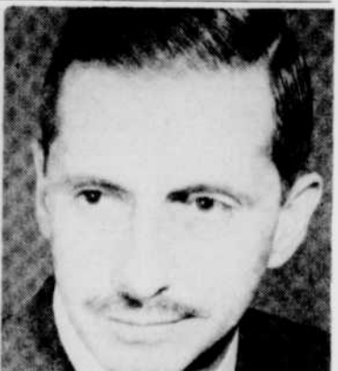
Deux invités cette semaine à CBF-FM et au réseau français de radio de Radio-Canada: l'écrivain argentin Jose Luis Borges, à «Documents», le mardi 7 décembre à 21 heures, et le géographe québécois Louis-Edmond Hamelin, à «Entretiens», le lundi 4 décembre à 22 h 30 et le vendredi 10 décembre à la même heure à CBF.