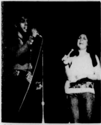
«L'Opéra Rock Jésus-Christ Super Star». Interviews avec des gens à