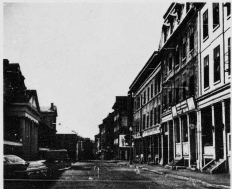
Rue St-Paul dans le Vieux Montréal St. Paul Street in Old Montreal

Montréal tire son nom de Mont-Royal ou Mont-Réal, le nom donné à cette élévation par Jacques Cartier, qui a découvert Hochelaga en 1535, l'année de son exploration du fleuve Saint-Laurent, probablement jusqu'au rapide qu'on appelle aujourd'hui Lachine. La montagne, de 769 pieds de hauteur, s'élève majestueusement au milieu de l'île qui est la plus grande du groupe d'îles formées par la rencontre de la rivière Ottawa et du fleuve Saint-Laurent. Cette île a 30 milles de longueur et de 7 à 10 milles de largeur et une superficie de 194 milles carrés. La ville actuelle couvre plus de 32,465.43 acres ayant, par annexion, surtout en 1883, grandi de 5,000 acres qu'elle était en 1860. Sa superficie de 50 milles carrés occupe un quart de l'île.