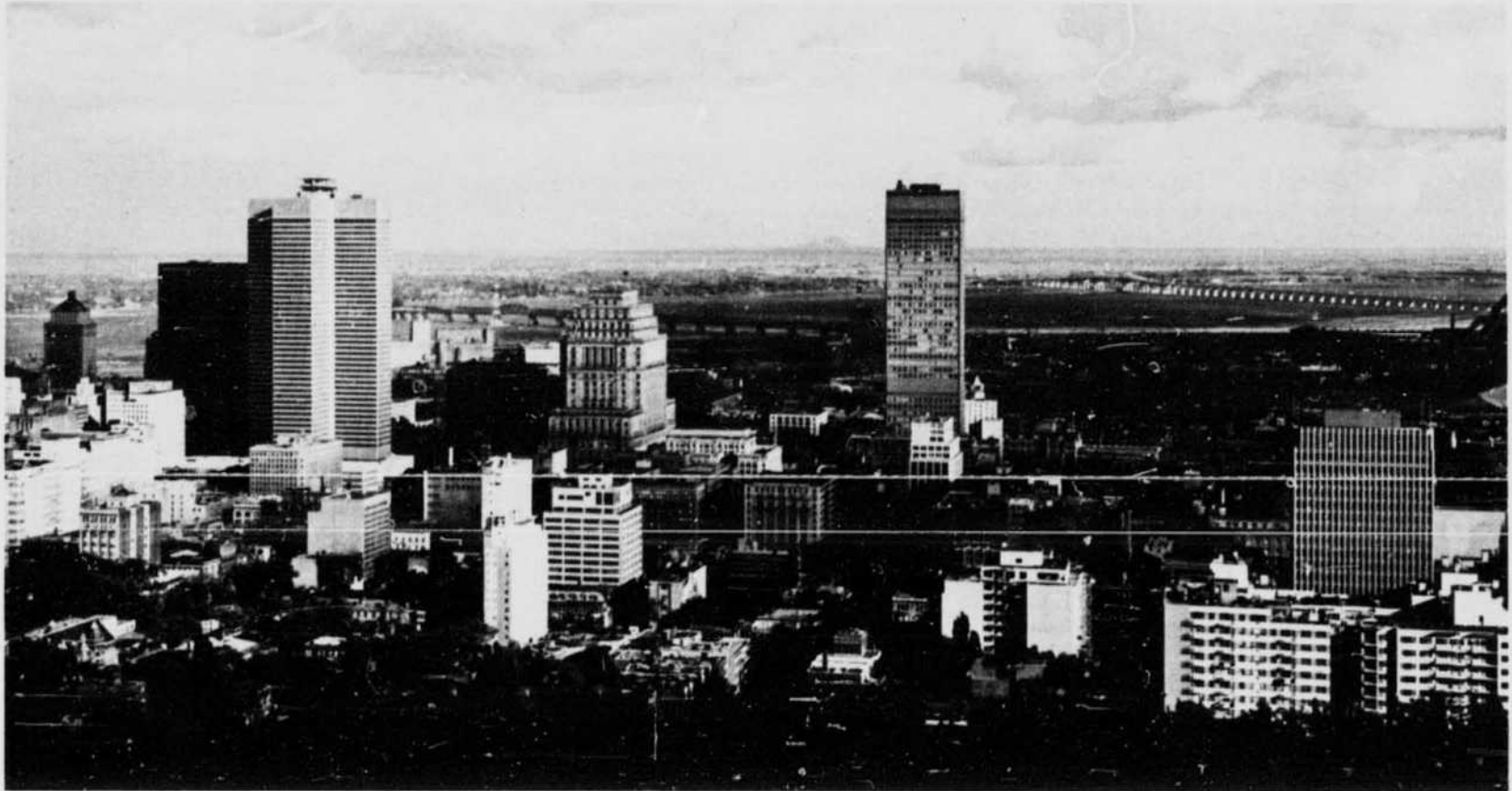
General view of Montreal from Mt. Royal