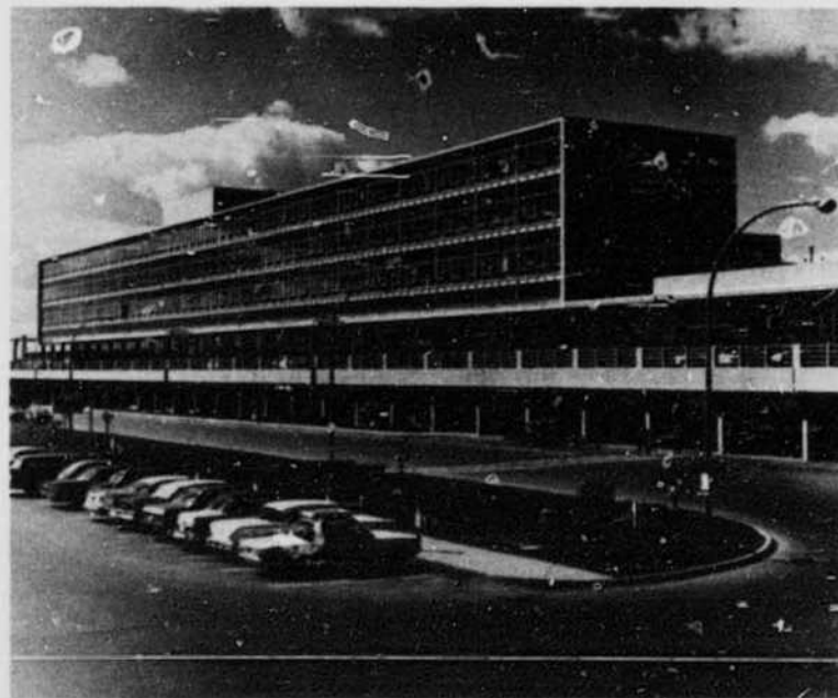
Aéroport International de Montréal, Dorval

La ville, à la fin de la lutte entre la France et l'Angleterre pour la suprématie de l'Amérique du Nord, capitula le 8 septembre 1760. Pendant la révolution américaine, la ville resta entre les mains des troupes du Congrès depuis la capitulation le 13 novembre 1775 jusqu'à son évacuation par Benedict Arnold en juin 1776. A partir de ce moment, le commerce commença à se développer: la compagnie du Nord d'Ouest, traiteurs, s'établit à Montréal en 1783-4, la "XY" en 1795-1804, et