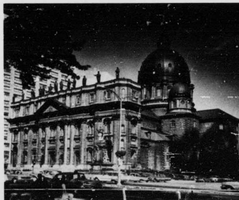
Cathédrale Marie Reine du Monde, boulevard Dorchester ouest Basilique Cathédrale Marie Reine du Monde, Dorchester Blvd West

L'autoroute panoramique des Laurentides, commencée en 1956 et terminée en 1960 jusqu'à Saint-Jérôme, part de Montréal à la sortie 17 du boulevard métropolitain, relie Montréal