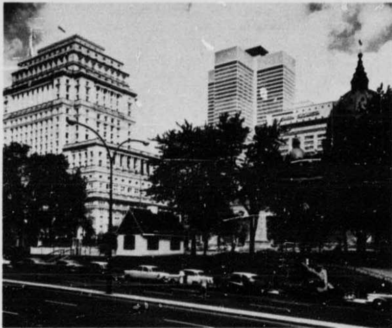
Place du Canada