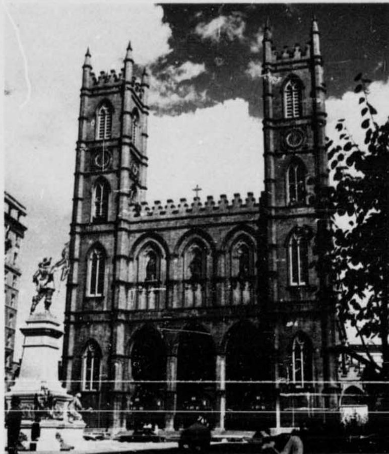
Notre Dame Church, Place d'Armes