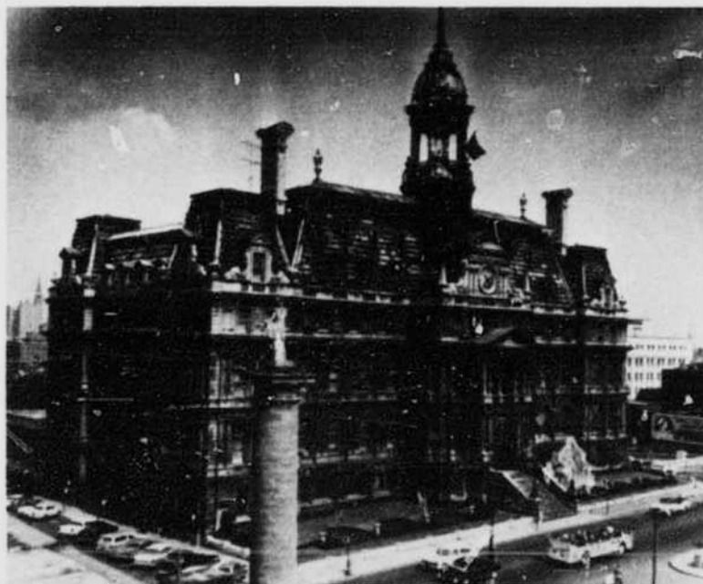
Montreal City Hall, Notre Dame Street West Hôtel de Ville de Montréal, rue Notre Dame ouest

Montreal's name comes from Mont-Royal or Mont-Réal, the title given this height by Jacques Cartier, who discovered Hochelaga in 1535, the year he explored the St. Lawrence River probably as far as the rapids, now called Lachine. Mont-Royal mountain, 769 feet high, stands nobly in the middle of an island, which is the largest of the group of islands formed by the confluence of the Ottawa and St. Lawrence Rivers. This island is 30 miles long and 7 to 10 miles wide, with an area of 194 square miles. The present City covers over 32,465.43 acres, having, by annexation, especially in 1883, grown from the 5,000 acres of 1860. It occupies one-quarter of the island and is 50 square miles in area.