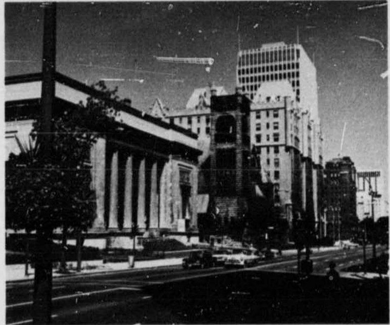
Montreal Museum of Fine Arts, Sherbrooke Street West Musée des Beaux-Arts de Montréal, rue Sherbrooke ouest

à l'Ile-Jésus, traverse la rivière des Mille-Iles jusqu'à Rosemere, puis se rend à Ste-Adèle. C'est une voie divisée avec quatre postes de péage, 67 ponts et croisements pontés.