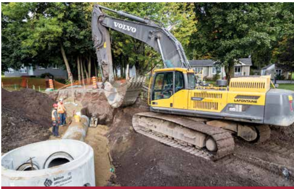
Les travaux commencés cette année continueront en 2017.

Enfin, les années 2017 et 2018 apporteront un certain nombre de modifications aux infrastructures existantes de la municipalité et la population en sera informée.