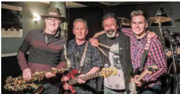
Le groupe The Smogs animera la soirée de leur musique.