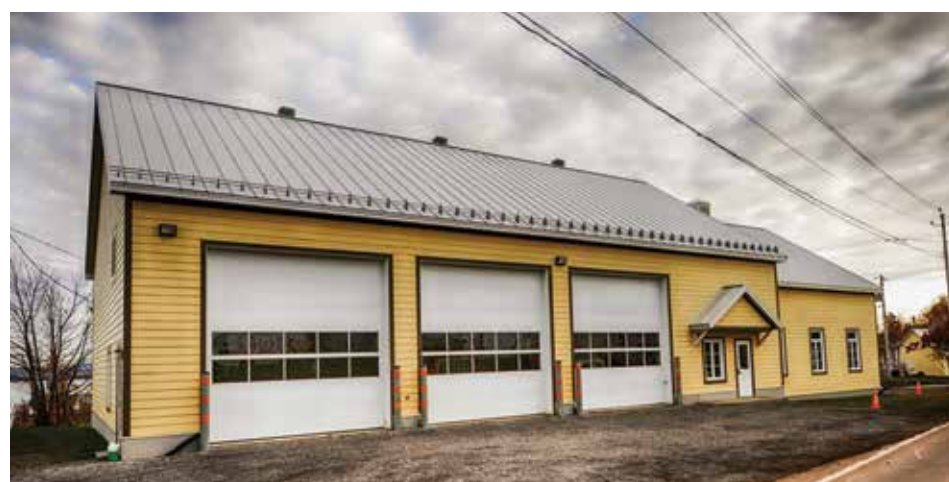
Caserne de Saint-Jean.

Rappelons qu'en juin 2014, le même conseil avait pris semblable position de retrait et que ce geste avait été suivi d'une négociation ayant mené à l'entente de janvier 2015.