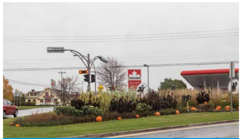
L'entrée de l'île.

*Inspiré d'une recette du chef Alain Ducasse