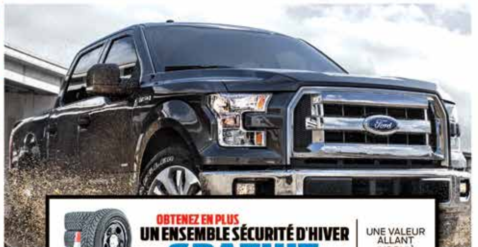
PHOTO À TITRE INDICATIF, LOCATION 60 MOIS, 16 000 KM. / ANNÉE. 500$ COMPTANT, TAXES EN SUS.