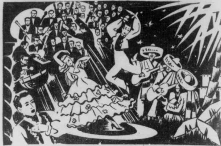
FIESTA MEXICANA! le 18 juin au Stade Molson. Voici l'impression d'un artiste local sur la "Fiesta Mexicana"; le premier des concerts sous les étoiles qui sera présenté mardi, le 18 juin, au Stade Molson l'amphithéâtre de l'avenue des Pins. Cette soirée entièrement consacrée à la musique, aux chansons et aux danses de l'Amérique du Sud, réunira quelques-uns des artistes les plus populaires auprès de nos voisins d'outre-frontière.

"Le carré Dominion est couvert des tulipes de Hollande que les armées de la civilisation n'ont pas écrasées, ces dernières années. Il y en a cent mille. Ne m'obstine pas, les reporters les ont comptés... Le maire de Montréal a reçu leurs Excellences de Tunis, l'autre jour. Il a très bien fait les choses et envoyé ses saluts aux Souverains... Westmount fait une campagne contre les permis de bière aux épiciers, ce qui signifie un surplus de clientèle pour les épiciers et les taverniers de l'est. Les geeks d'outre-Atwater n'ont plus permission non plus de laisser courir librement leurs chiens dans les parcs; alors ils les amènent dans les districts de l'est. L'unité nationale va y gagner, tu le conçois!... Paul L'Anglais (notre Paul national) part une grosse compagnie de cinéma avec studios à Valcartier. Premier film: "Rendez-vous au Château Frontenac". Si tu revenais, tu aurais peut-