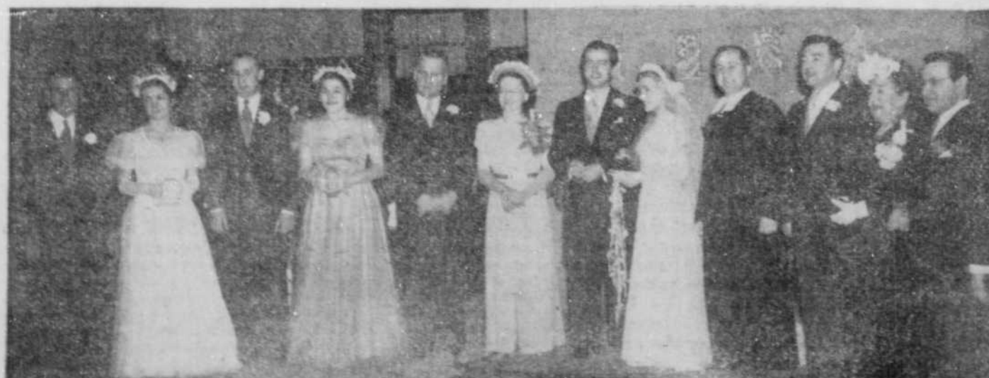
★ Le cortège nuptial et les membres de la Famille.