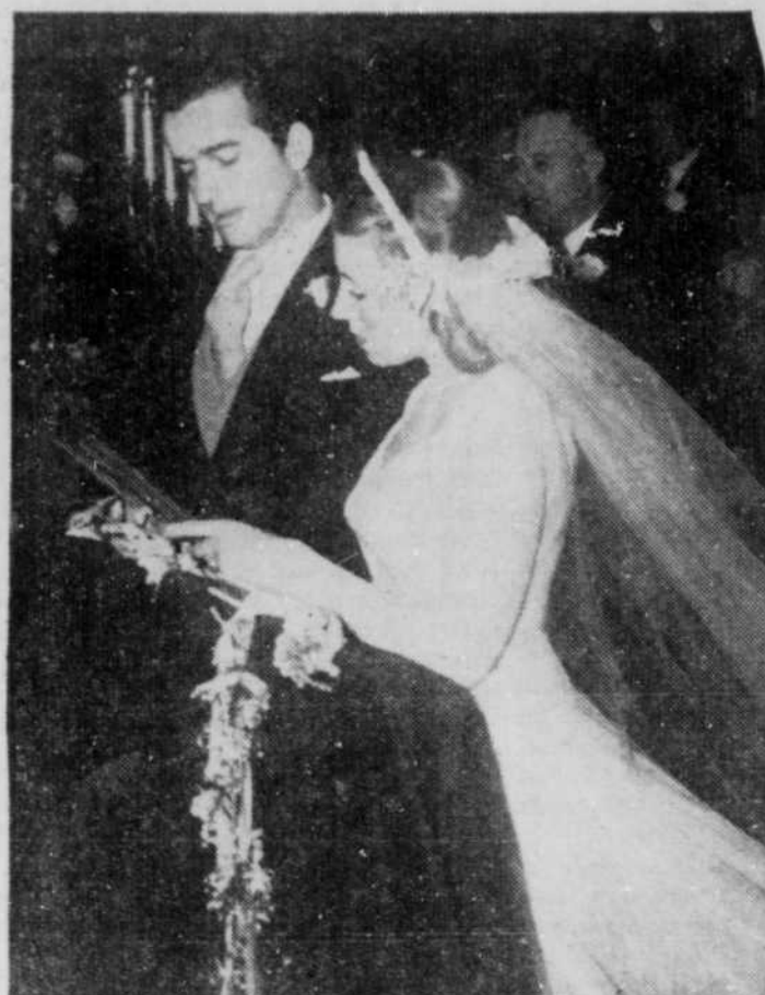
★ Le moment solennel