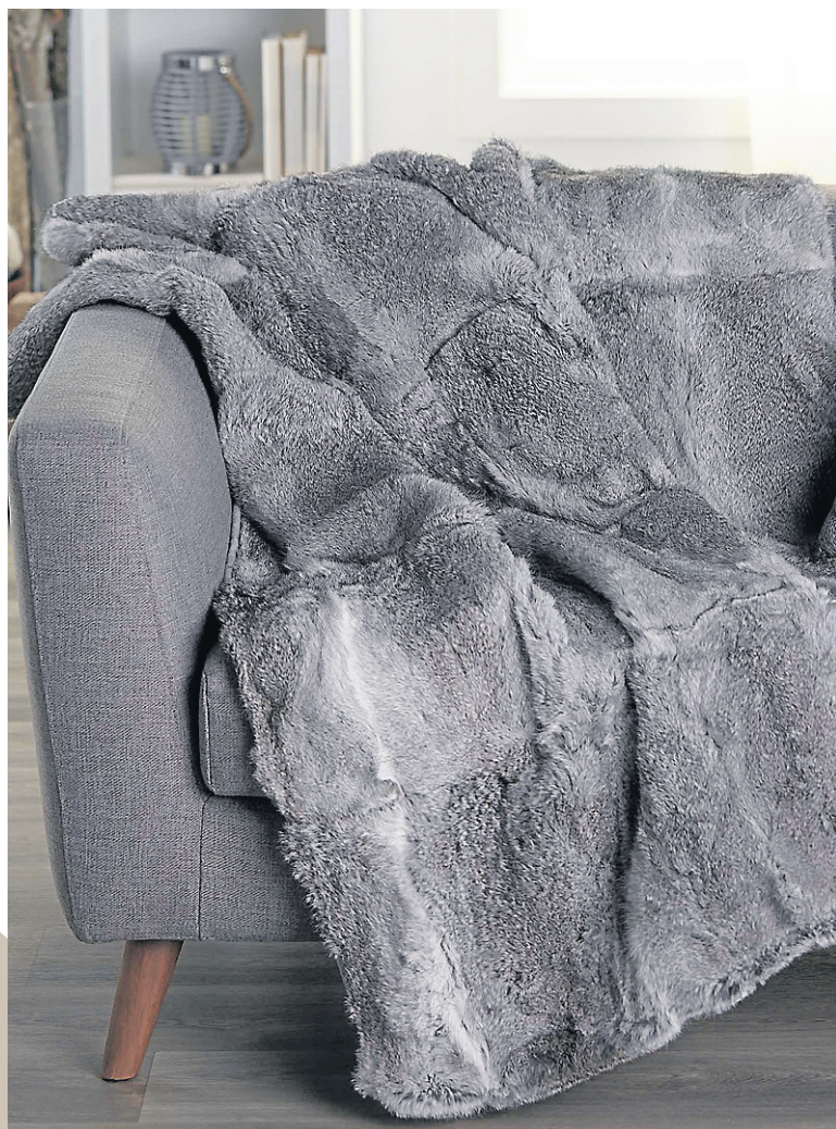
Le jeté fourrure de lapin grise vous tiendra bien au chaud. Format 130x150 cm. Maison Simons.

Voici quelques items pour recréer à la maison le décor et l'ambiance chaleureuse du chalet.