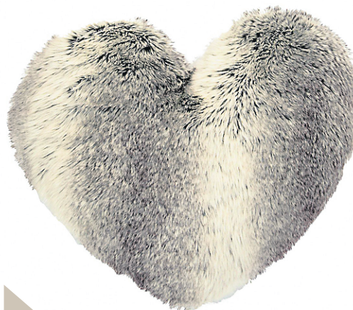
Un petit coeur chaleureux fait de fausse fourrure de la collection Coyote de Brunelli pour ajouter confort et chaleur au salon ou dans la chambre à coucher. Disponible en exclusivité chez votre détaillant Brunelli.