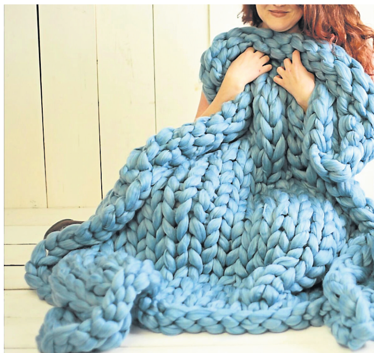
Les frileuses et les frileux vont adorer se blottir dans cette couverture tricotée à la main en laine de Merinos. Une création Unrefined Canada, en vente sur Etsy.