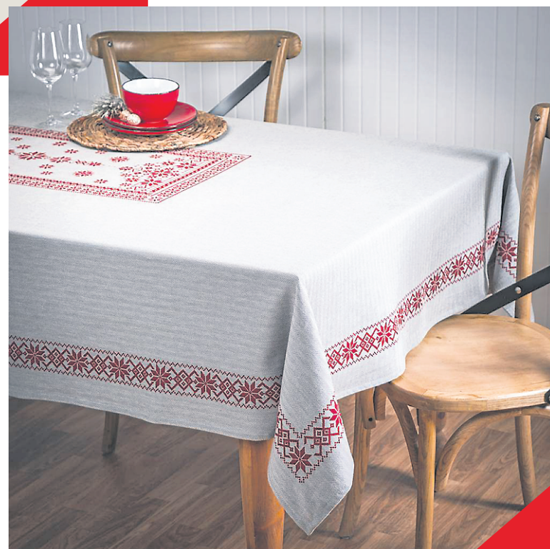
Nappe en tweed à chevrons avec imprimés rouges, Ricardo