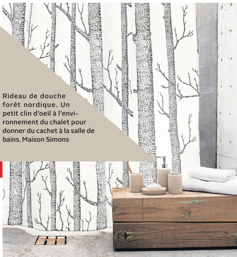
Rideau de douche forêt nordique. Un petit clin d'oeil à l'environnement du chalet pour donner du cachet à la salle de bains. Maison Simons