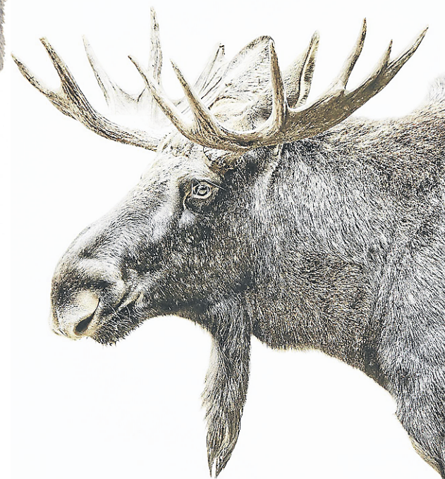
Complétez votre décor d'inspiration chalet avec ce portrait d'original au profil imposant. Maison Simons.