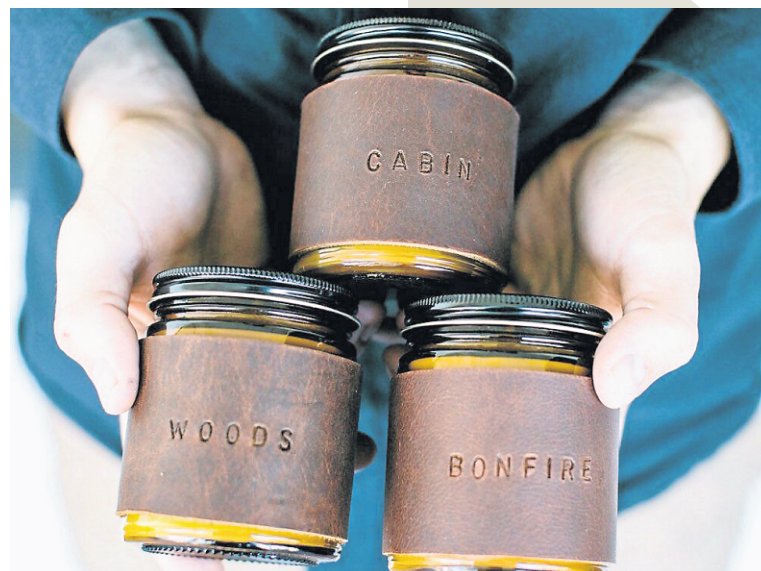
Avec leur étiquette de cuir et le parfum de pin ou de patchouli, les bougies Brand & Iron sont parfaites pour créer une ambiance rappelant celle du chalet. Les produits Brand & Iron Quality Goods sont en vente sur Etsy.