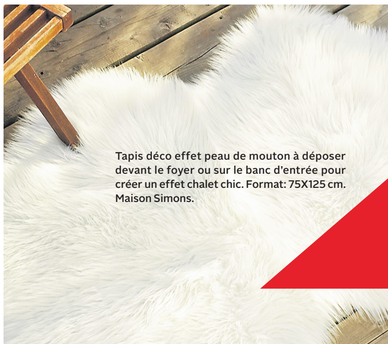
Tapis déco effet peau de mouton à déposer devant le foyer ou sur le banc d'entrée pour créer un effet chalet chic. Format: 75X125 cm. Maison Simons.