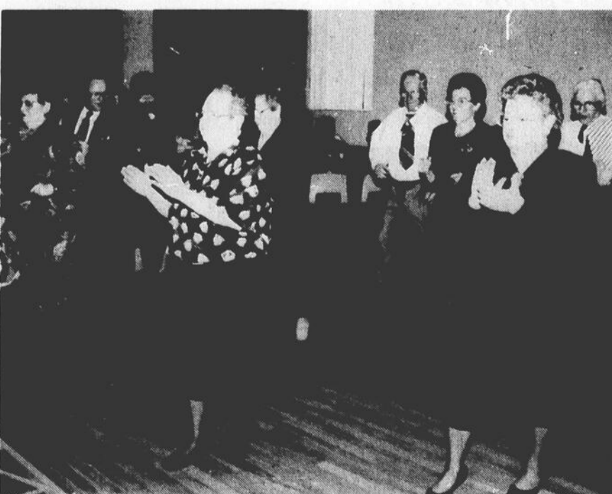
Un divertissement fort intéressant à l'Age d'Or se veut la danse de ligne. Les dames ont démontré qu'ils ont le dessus sur les hommes à les regarder, c'en était essoufflant.