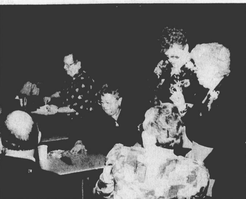
À l'Age d'Or de Huntingdon, on trouve des moyens de s'amuser en organisant des petits tirages. Ce fut le cas lors de la soirée de Noël tenue le mercredi 1er décembre.