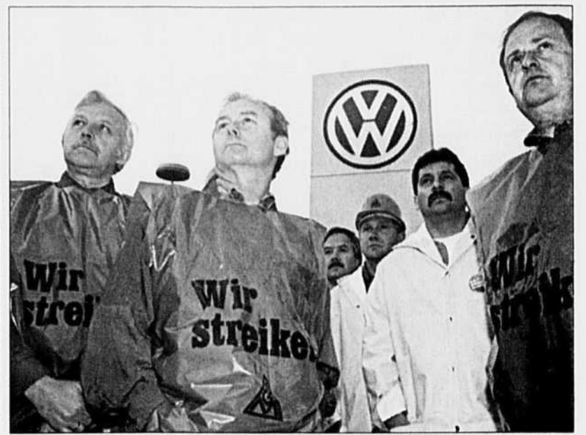
«Nous sommes en grève» et que cela soit écrit: les employés de Volkswagen, au «repos» hier.

Si l'OMS était démantelée ou si elle voyait son budget se réduire sérieusement, et si les Etats-Unis, qui sont les plus déterminés en ce sens, se retirent (ils contribuent à eux seuls à plus du quart de ce budget), ce n'est pas seulement les quelque quatre mille six cents employés de l'organisation qui en pâtiront mais aussi et surtout les pays du tiers monde; où un milliard et demi de personnes n'ont pas accès à des services de santé suffisants.