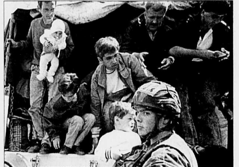
Le soldat britannique aidait hier les réfugiés musulmans à descendre du camion qui les a conduits à bon port, à Travnik (centre de la Bosnie).

Selon des études préliminaires, il faudrait entre 60 000 et 75 000 soldats chargés d'une mission de maintien de la paix, avec notamment le contrôle des armes lourdes, le retrait des Serbes des zones affectées à d'autres communautés, la démilitarisation de Sarajevo. Le parlement des Serbes de Bosnie, qui doit se réunir demain, s'est montré jusqu'à présent particulièrement rétif.