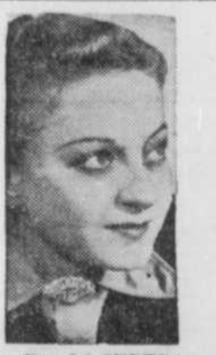
PER LA CENTRA