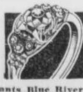
Diamants Blue River