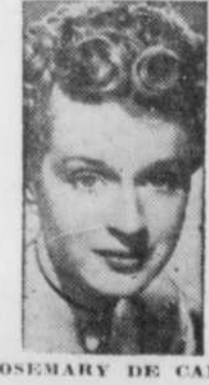
ROSEMARY DE CAMP

"Pour arriver au succès, dit-elle, en terminant, il faut travailler arduement, ne pas vouloir atteindre les sommets trop rapidement, et être guidé selon ses aptitudes sans chercher à copier, mais en développant plutôt sa personnalité qui peut donner au Canada des artistes susceptibles d'établir, sinon de surpasser, ceux des autres pays, pourvu qu'on veuille bien s'en donner la peine!"