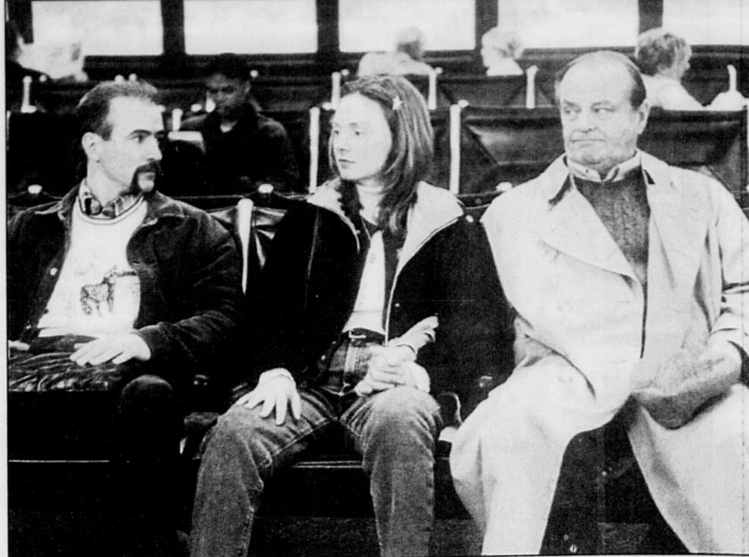
Dermot Mulroney, Hope Davis et Jack Nicholson jouent dans la comédie noire «About Schmidt», d'Alexander Payne, élue meilleur film de l'année par l'Association des critiques de cinéma de Los Angeles.