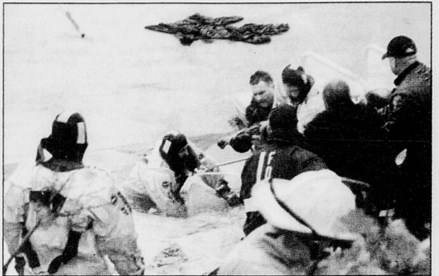
Un deuil froid a saisi hier la communauté de Lawrence, au Massachusetts, à la suite du décès de quatre garçons qui sont morts en tombant dans les eaux glacées de la rivière Merrimack. Six garçons âgés de 7 à 11 ans s'amusaient samedi après-midi sur la surface gelée de la rivière Merrimack lorsque la glace a cédé sous leur poids. Deux d'entre eux ont pu être secourus mais les quatre autres sont morts d'hypothermie. Les policiers arrivés très vite sur les lieux ont formé une chaîne humaine et ont pu se saisir des deux enfants les plus proches de la rive, restés au-dessus de la surface. C'est alors qu'ils ont appris que quatre autres garçons étaient prisonniers de la glace.