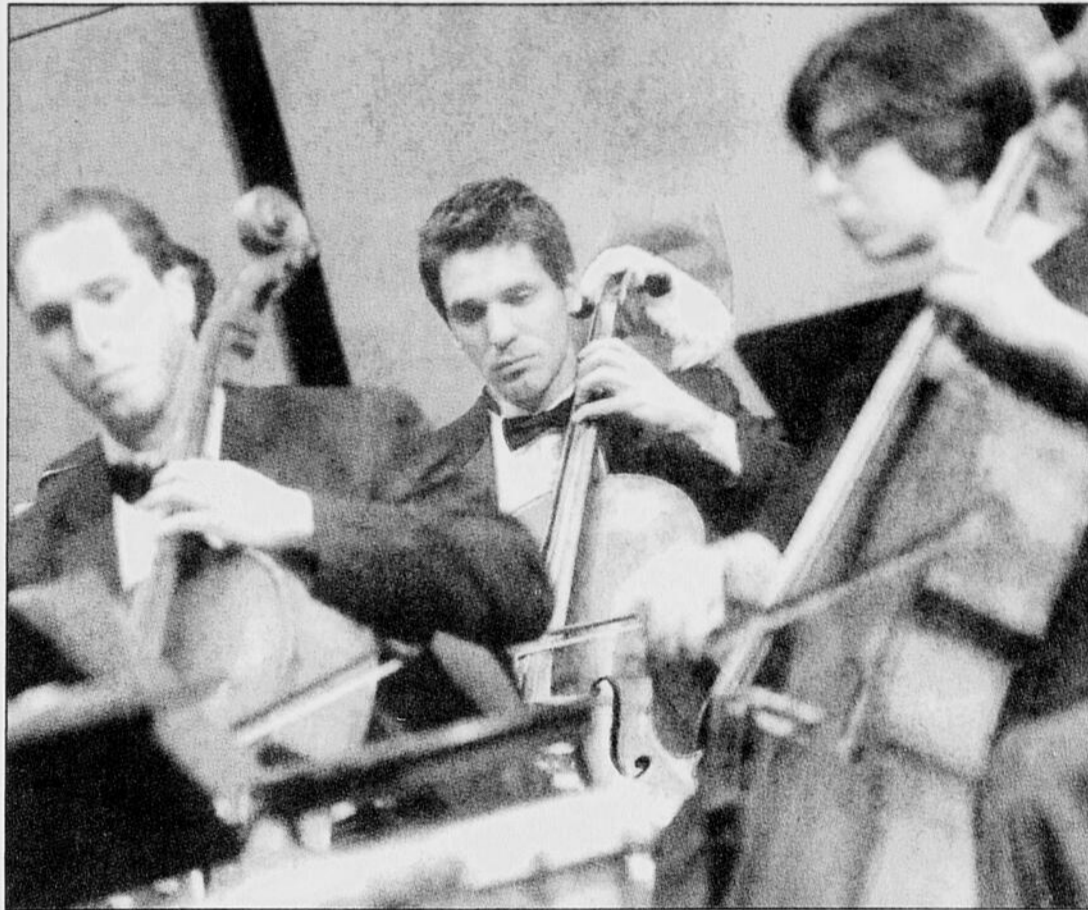
Plusieurs musiciens de l'Orchestre symphonique de Sherbrooke avaient apporté une tuque, des bois de rennes ou des guirlandes pour agrémenter le concert de Noël présenté hier.

Les spectacles Bleue LE VIEUX CLOCHER Magog 64, rue Merry Nord, Magog (819) 847-0470